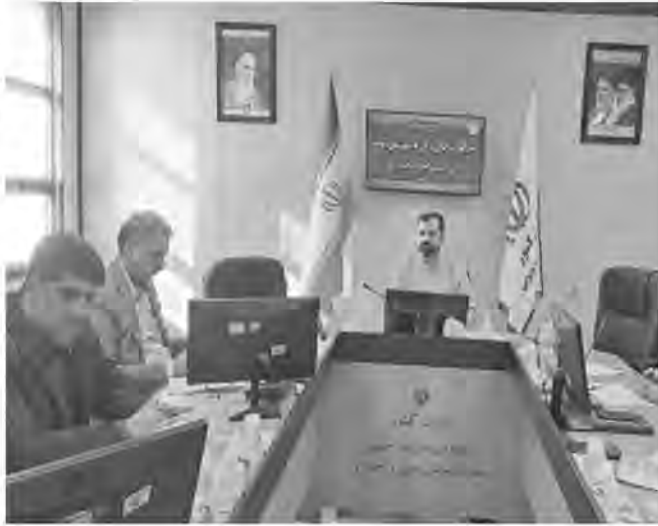
کرد: نباید دستگاه‌های اجرایی وظایف سازمانی خود را به جای اقدامات مورد نظر در راستای اجرای این طرح گزارش کنند و براساس تفاهنامه‌های کشوری باید با هم همکاری داشته باشند.

معاون سیاسی، امنیتی و اجتماعی استاندار خراسان جنوبی گفت: برای اجرای طرح توانمندسازی محلات کم‌برخوردار استان به ایجاد یک شبکه بین دستگاه‌های مورد نظر نیاز داریم که تاکنون این کار انجام نشده است. به گزارش امروز خراسان جنوبی، سید محمدرضا طالبی در جلسه کارگروه اجتماعی، فرهنگی، سلامت زنان و خانواده (طرح توانمندسازی محلات کم‌برخوردار استان) افزود: تا زمانی که این اتفاق رقم نخورد، موفقیتی در این خصوص نخواهیم داشت. وی گفت: دستگاه‌هایی که در اجرای طرح توانمندسازی محلات کم‌برخوردار مشارکت دارند، باید با تعامل بیشتر از همه ظرفیت‌های موجود استفاده کنند. معاون استاندار خراسان جنوبی تصریح