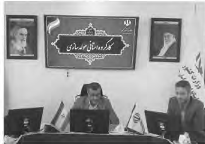
شده که نبود تحقق آن تأثیر مستقیمی بر روی سهم اعتبار اختصاصی استان خواهد داشت.

مدیرکل امور اقتصادی و دارایی خراسان جنوبی عنوان کرد: چهار پرونده هم برای لغو مجوز فروش به وزارت اقتصاد ارسال شده اما با لغو مجوز آن موافقت نشده است. ذاکریان از شناسایی سه ملک مازاد دولتی در سال جاری در خراسان جنوبی خبر داد و گفت: در حال دریافت اخذ مجوز از وزارت اقتصاد و دارایی برای فروش آن هستیم. وی خاطرنشان کرد: در سال جاری سهم خراسان جنوبی از محل فروش املاک مازاد دولتی ۲۰۰ میلیارد تومان مشخص