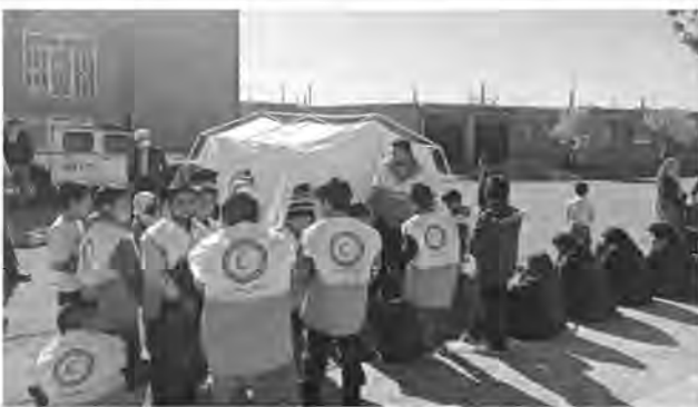
کاووسی با بیان اینکه سه حادثه بزرگ خشکسالی، سیل و زلزله همواره مردم خراسان جنوبی را تهدید می کند، افزود: با برگزاری تمرین

ها مردم می توانند در حوادث با تمرکز و مهارت بیشتری وارد میدان شوند. وی با اشاره به اینکه مانور اسکان اضطراری در ۳۳ خانه هلال در استان برگزار شده است، گفت: در این مانور صفر تا صد امور توسط خود مردم و به صورت عملیاتی انجام شده است. مدیرعامل جمعیت هلال احمر خراسان جنوبی افزود: این مانور با شرکت بیش از ۲ هزار نفر در بازه زمانی ۳۱ تا ۳۰ آبان امسال، با سناریوی زلزله فرضی به قدرت ۶.۵ ریشتر برگزار شده است.