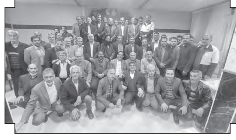
مدیر عامل اتحادیه دامداران خراسان جنوبی با قدرانی از تلاش های این دو خادم حوزه دام و طیور استان از مسئولان استان در خواست کرد اگر قرار است تغییر و تحولی در حوزه مدیریتی دام و طیور اتفاق بیفتد با تشکل ها، اتحادیه ها و معتمدین این بخش ها هم مشورتی بشود تا افراد دغدغه مند و در آشنایان و ارد این عرصه بشوند.