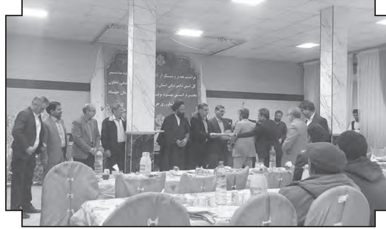
مدیر عامل مجتمع مرغ مادر خراسان جنوبی هم در این جلسه از مسئولان خواست، در مواقع اتخاذ تصمیمات برای حوزه دام و طیور خودشان را بجای تولید کننده بگذارند و در ادامه افزود: فروش مرغ به کمتر از قیمت مصوب و قیمت تمام شده، مرغداران را متضرر کرده که باید جبران شود. خبریه هم از اینکه مسئولان و تعزیرات فقط موقع افزایش قیمت بازار به سراغ مرغدار می آیند و موقع کاهش قیمت ها هیچ حمایتی از آنها نمی شود هم انتقاد کرد و اذعان داشت: حمایت از مرغدار باید دو جانبه باشد و سالانه یک قیمت میانگین برای مرغ تعیین شود و اگر از این قیمت اندکی بالاتر رفت بطور مثال تا ۲۰ درصد به جرم گران فروشی به سراغش نیایند همان طور که در مقاطع زیادی قیمت مرغ کمتر از نرخ مصوب عرضه می شود و حمایتی از مرغدار نمی شود.

در مراسم تکریم دو نفر از خادمان صنعت دام و طیور استان مطرح شد: