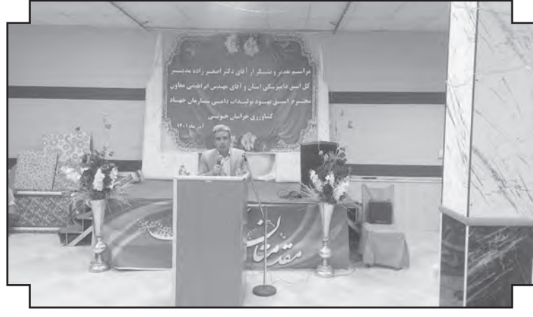
مدیر کل اسبق دامپزشکی خراسان جنوبی هم در این جلسه از مسئولان خواست، در مواقع اتخاذ تصمیمات برای حوزه دام و طیور خودشان را بجای تولید کننده بگذارند و در ادامه افزود: فروش مرغ به کمتر از قیمت مصوب و قیمت تمام شده، مرغداران را متضرر کرده که باید جبران شود. خبریه هم از اینکه مسئولان و تعزیرات فقط موقع افزایش قیمت بازار به سراغ مرغدار می آیند و موقع کاهش قیمت ها هیچ حمایتی از آنها نمی شود هم انتقاد کرد و اذعان داشت: حمایت از مرغدار باید دو جانبه باشد و سالانه یک قیمت میانگین برای مرغ تعیین شود و اگر از این قیمت اندکی بالاتر رفت بطور مثال تا ۲۰ درصد به جرم گران فروشی به سراغش نیایند همان طور که در مقاطع زیادی قیمت مرغ کمتر از نرخ مصوب عرضه می شود و حمایتی از مرغدار نمی شود.

مدیر عامل اتحادیه دامداران خراسان جنوبی با قدرانی از تلاش های این دو خادم حوزه دام و طیور استان از مسئولان استان در خواست کرد اگر قرار است تغییر و تحولی در حوزه مدیریتی دام و طیور اتفاق بیفتد با تشکل ها، اتحادیه ها و معتمدین این بخش ها هم مشورتی بشود تا افراد دغدغه مند و در آشنایان و ارد این عرصه بشوند.