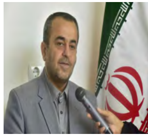
وزیر اقتصاد و دارایی در این سفر رئیس جمهور را همراهی می‌کنند. علی‌اکبر محرابیان وزیر

کشور، سید مسعود میرکاظمی معاون رئیس جمهور و رئیس سازمان برنامه و بودجه، بهرام عین‌اللهی وزیر بهداشت، درمان کابینه‌اش وی را همراهی خواهند کرد. قناعت افزود: هر کدام از این معاونان و وزرا به عنوان نماینده تمام الاختیار رئیس جمهور در شهرستان‌های استان حضور پیدا می‌کنند. وزیر نفت، سید امیرحسین محروم و سید احسان خاندوزی