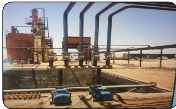
ساخت گری بانک ها برای اخذ تسهیلات

نیازمند نگاه ویژه دولت سیزدهم هستیم تا این واحد راه اندازی شود. اذعان داشت: هدف ما رونق تولید و اشتغال در راستای فرامین رهبر معظم انقلاب در محرومیت زدایی از استان محروم و مظلوم خراسان جنوبی و بالخصوص شهرستان خوسف بوده ولی متأسفانه صنعت و صنعتگر، چه در داخل و چه در تحریم های ظالمانه بین المللی، مظلوم واقع شده است. این در حالی است که هنوز تسهیلات تبصره ۱۸ تخصیص پیدا نکرده و تمام صنعت استان، با توجه به حجم مشکلات فرصت چندانی برای جبران هزینه ها نداشته سرمایه گذاری موجود کلاً از بین رفته و تخصیص دیر هنگام منابع وام تبصره ۱۸ نیز تغییری در سرنوشت این واحد تولیدی نخواهد داد و نوشدارویی بعد مرگ سهراب خواهد بود.