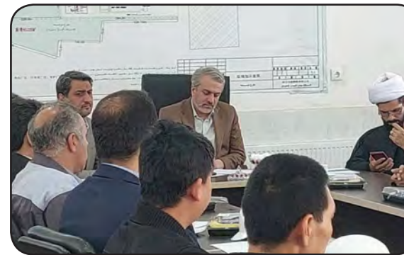
ساخت گری بانک ها برای اخذ تسهیلات