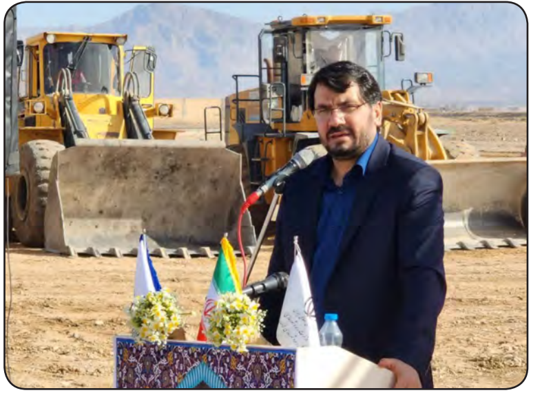
تحویل خانه های حیاط دار یک طبقه در طرح نهضت ملی مسکن طبس وزیر راه و شهرسازی در اولین بازدید از پروژه نهضت ملی مسکن طبس، کلید خانه های یک طبقه حیاط دار را به متقاضیان تحویل داد. در این مراسم، وزیر راه و شهرسازی با اشاره به اهمیت این طرح، گفت: این واحدها با بهره مندی از الگوی ایرانی-اسلامی، با فضای حیاط و سبک معماری مناسب، نیازهای اساسی مردم را برطرف می کند.

وزیر راه و شهرسازی، مهرداد بذریاش در اولین سفر از دور دومین سفرهای استانی هیات دولت پنجشنبه گذشته در بدو ورود به استان خراسان جنوبی، در گلزار شهدای شهرستان طبس حضور یافت. در این سفر، برنامه تحویل کلید واحدهای مسکونی یک طبقه حیاط دار، آغاز عملیات اجرایی و آماده سازی سایت