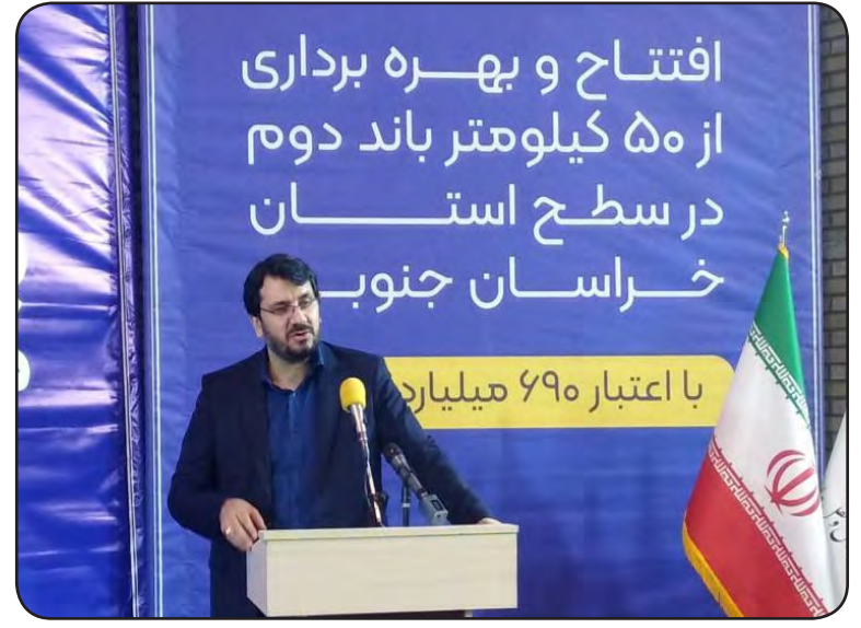
افتتاح و بهره برداری از ۵۰ کیلومتر باند دوم در سطح استان خراسان جنوبی با اعتبار ۶۹۰ میلیارد تومان بازدید از پروژه نهضت ملی مسکن سایت زعفرانیه بیرجند همچنین وزیر راه و شهرسازی از پروژه نهضت ملی مسکن ملی سایت زعفرانیه بیرجند که توسط انبوه سازان به عنوان یکی از بزرگترین پروژه های استان خراسان جنوبی در طرح نهضت مسکن

از آن به اتمام رسیده است. مهندس داعی افزود: خدمات زیربنایی اعم از آب، برق و گاز در این سایت فراهم شده و تسهیلاتی به مبلغ ۳۰۰ میلیون تومان برای ساخت به متقاضیان اعطا شده است و هم اکنون در شهرستان طبس سه سایت ۷۹،۵۰ و ۳۵۰ هکتاری طرح نهضت ملی مسکن در حال ساخت و ساز است.