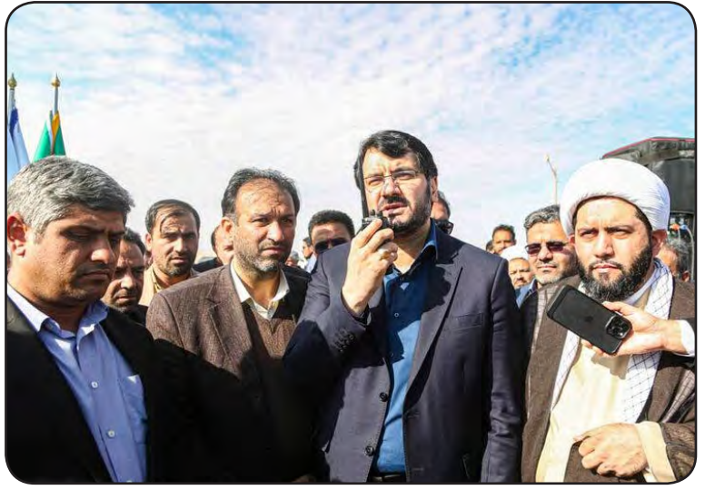
بازدید از ایستگاه راه آهن طبس، افتتاح و بهره برداری از ۵۰ کیلومتر باند دوم در سطح استان با اعتبار ۶۹۰ میلیارد تومان در محور بیرجند-قاین، آغاز عملیات اجرایی آماده سازی اراضی نهضت ملی مسکن سریشه و بازدید از پروژه های نهضت ملی مسکن در بیرجند انجام شد.

سفر به سریشه و حضور در مراسم آغاز عملیات اجرایی آماده سازی اراضی طرح نهضت ملی مسکن از دیگر برنامه های این سفر بود.