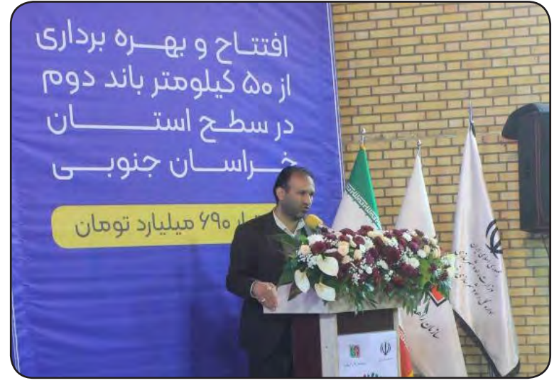
افتتاح و بهره برداری از ۵۰ کیلومتر باند دوم در سطح استان خراسان جنوبی با اعتبار ۶۹۰ میلیارد تومان بازدید شامگاهی وزیر راه و شهرسازی از پروژه های طرح نهضت ملی مسکن بیرجند وزیر راه و شهرسازی در شامگاه پنجشنبه ۲۴ آذرماه از پروژه های در دست ساخت طرح نهضت ملی مسکن در بیرجند هم بازدید کرد.

بذریاش خاطرنشان کرد: کریدورها و شبکه مواصلاتی کشور به دلیل کمبود منابع کافی و یا تحریم ها تاکنون تکمیل نشده و این موضوع در اولویت کار ماست، بنابراین همه توان خود را برای تأمین منابع لازم به منظور تکمیل راه های ریلی و جاده های گدازشت، وی با بیان اینکه این کشور جز به دست خودمان ساخته نخواهد شد، افزود: دست یاری و کمک دراز می کشم تا وزارت راه و شهرسازی را به پیشران پیشرفت کشور تبدیل کنیم. به گفته بذریاش، همه اقدامات انجام گرفته در مسیر توسعه و عمران کشور از حوزه حمل و نقل تا مسکن برای مردم امیدآفرین بوده و در اقتصاد کشور تأثیرگذار است.