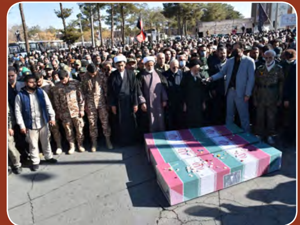
گزارش تصویری از حضور باشکوه مردم استان در مراسم وداع و تشییع پیکر مطهر شهدای گمنام