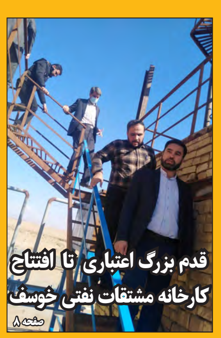
قدم بزرگ اعتباری تا افتتاح کارخانه مشتقات نفتی خوسف صفحه ۸