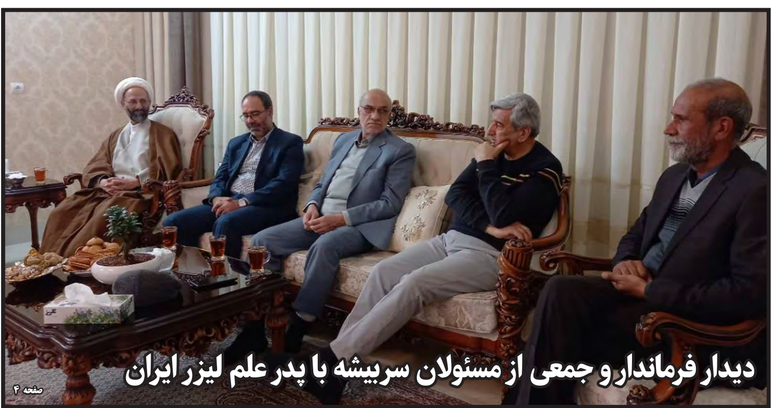
دیدار فرماندار و جمعی از مسئولان سرپیشه با پدر علم لیزر ایران صفحه ۴