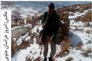
سربازان، زیرکوه، بشرویه و نهبندان با اهدای بیش از ۲ تن دان و علوفه برای خداسرانی به حیات وحش در این امر مشارکت کرده اند.

امروز خراسان جنوبی - صادقی خیران بیش از ۲ تن دان و علوفه برای حیات وحش استان خراسان جنوبی اهدا کردند. سرمای بی سابقه هوا، گونه های مختلف جانوری را برای یافتن غذا با مشکل مواجه می کند. بارش برف در مناطق زندگی جانوران و سرمای هوا، باعث کمبود مواد غذایی در طبیعت شده است. این روزهای سرد با همت خیران برای جانوران هم گرم و قابل تحمل شده است. علاقمندان به حیات وحش در استان دان و علوفه برای جانوران تأمین و به محیط زیست استان اهدا کردند. مدیرکل حفاظت محیط زیست استان خراسان جنوبی درباره میزان کمک های خیران گفت: خیران از شهرستان های بیرجند،