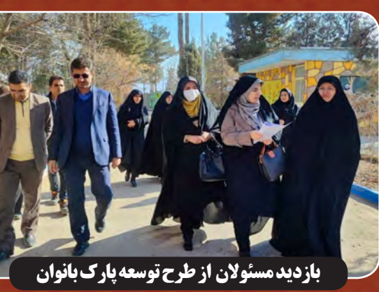
بازدید مسئولان از طرح توسعه پارک بانوان