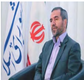
محرز بوده است.

وی افزود: یکی از دلایل این اقدام پارلمان اروپا می تواند نامیدی دشمن از آثار حداکثری و صد درصدی تحریمها باشد از طرف دیگر، دشمن به اغتشاشات اخیر که چند ماه طول کشید دل بسته بود و بعد از اینکه در این قضیه هم شکست خورد، به این کار دست زد. خسروی بیان کرد: از نظر قواعد عمومی روابط بین الملل، اینکه یک نهاد رسمی و قانونی متعلق به نظام را تروریستی اعلام کنند، عملی خلاف، غیرعقلانه و غیرمنصفانه است، اگر این موضوع پذیرفته هم باشد در مورد خودشان کمک در تأمین واکسن، برای مردم