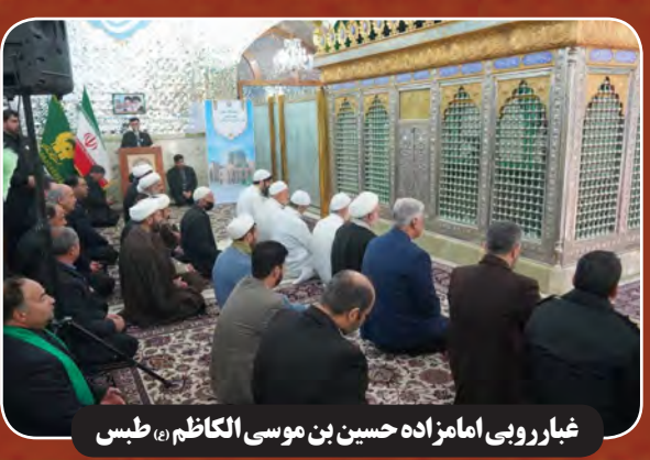
غبارروبی امامزاده حسین بن موسی الکاظم (ع) طبری