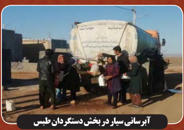
آبرسانی سیار در بخش دستگردان طبری