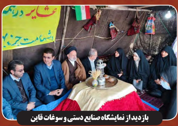
بازدید از نمایشگاه صنایع دستی و سوغات قاین