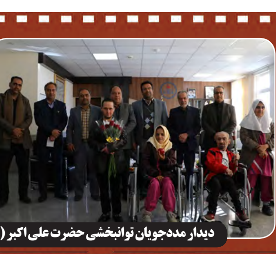
دیدار مددجویان توانبخشی حضرت علی اکبر (ع) با مدیر عامل و کارکنان شرکت گاز خراسان جنوبی