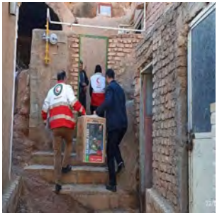
وسایل گرمایشی از سوی محکوم تهیه شد.

و با حضور نماینده دادستانی، هلال احمر، بهزیستی، دهیاران و مسئولان خانه‌های هلال در روستاهای رقه، باغدک، موردستان، یگی و خداآفرید توزیع شد. وی ادامه داد: صدور این گونه از احکام در زمینه افزایش احساس نوع دوستی که خود یک نوع آموزش اخلاقی جهت ارتقا و ترویج روش صحیح زندگی در اجتماع است گام مؤثری برای سلامت جامعه محسوب می‌شود.