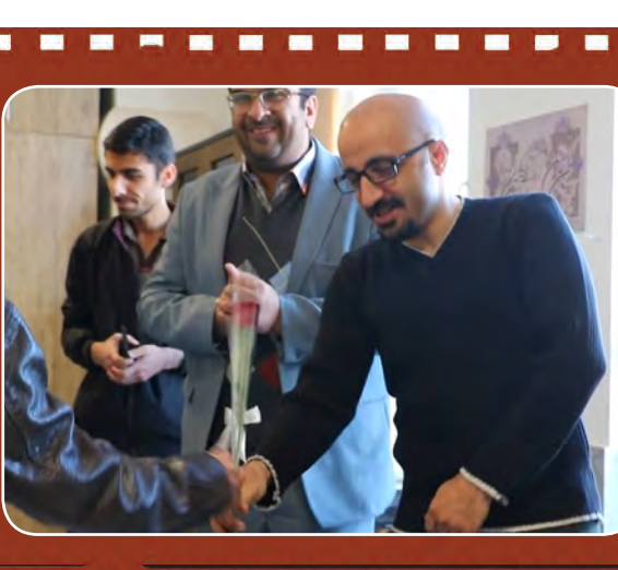
دیدار مددجویان توانبخشی حضرت علی اکبر (ع) با مدیر عامل و کارکنان شرکت گاز خراسان جنوبی