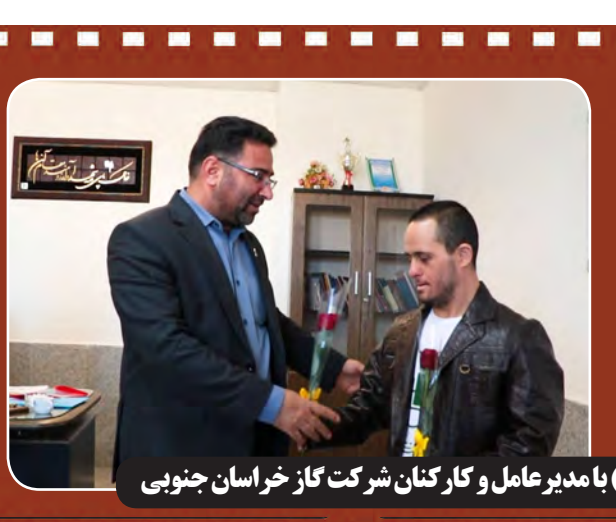
دیدار مددجویان توانبخشی حضرت علی اکبر (ع) با مدیر عامل و کارکنان شرکت گاز خراسان جنوبی