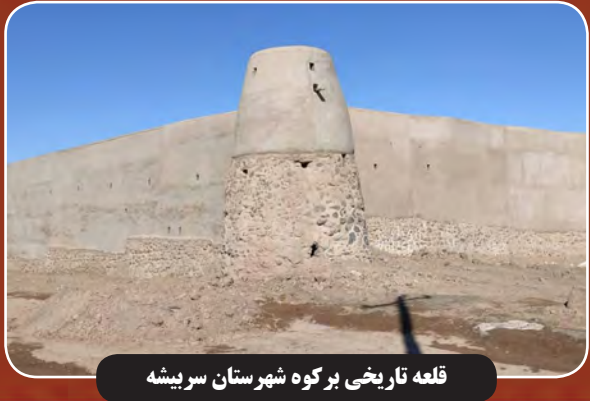
قلعه تاریخی بر کوه شهرستان سریش