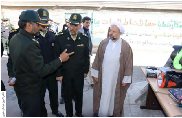
سید علی اکبر (ع) در جریان بازدید

امروز خراسان جنوبی - گروه حوادث تأثیر تردد ناامن قاچاقچیان سوخت موسوم به شوتی در جاده های استان باعث شده مسئولان برای مقابله با تهدیدی که به خود و دیگران تحمیل می کنند بسیار جدی برخورد کنند. دادستان عمومی و انقلاب مرکز استان روز گذشته در جمع خبرنگاران، امنیت مردم را خط قرمز سیستم قضایی ذکر کرد و گفت: با توجه به افزایش آمار تصادفات در استان و اینکه یکی از علل این افزایش، خودروهای سوخت‌کش به اصطلاح شوتی هستند که هزاران لیتر سوخت قاچاق را در خودروهای میلیون تومانی سودناشروع کسب می کنند، در شورای تأمین استان مصوب کردیم به محض دستگیری این افراد، خودروهای آن‌ها بین ۳ تا ۶ ماه توقیف گردد.