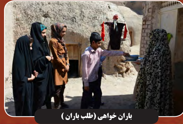
باران خواهی (طلب باران)

نقدی، معاون هماهنگی کننده سپاه پاسداران انقلاب اسلامی گفت: مسئولین کشور به صراحت اعلام کرده اند که ما هیچ دخالتی در جنگ روسیه و اوکراین نداریم. هیچ سلاحی، به هیچ یک از طرف های جنگ نداریم. امکان دارد که قبل از وقوع جنگ، سلاحی فروخته شده باشد، ولی بعد از وقوع جنگ سلاحی به هیچ یک از طرفین نداریم.