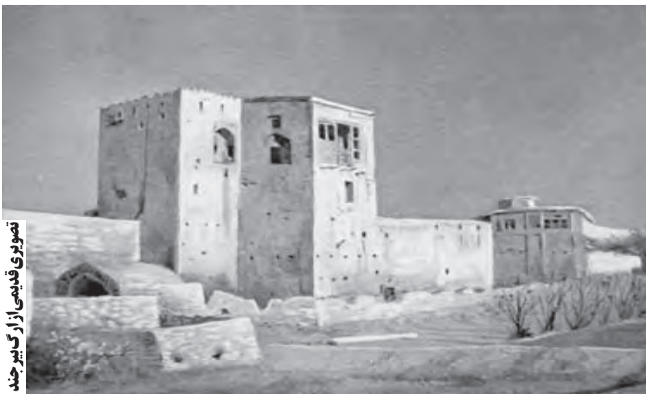
تصویری قدیمی از آزار بیرجند