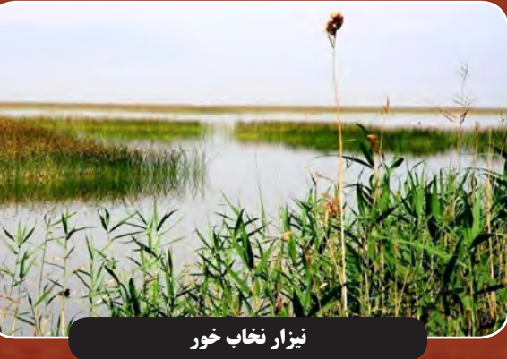
نزار نخاب خور