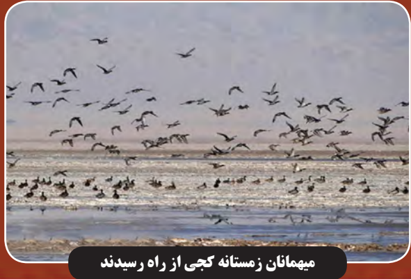
میهمانان زمستانه کجی از راه رسیدند