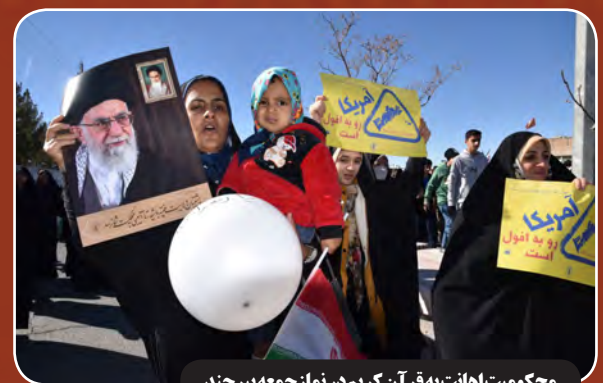
محکومیت اهانته به قرآن کریم در نماز جمعه بیرجند