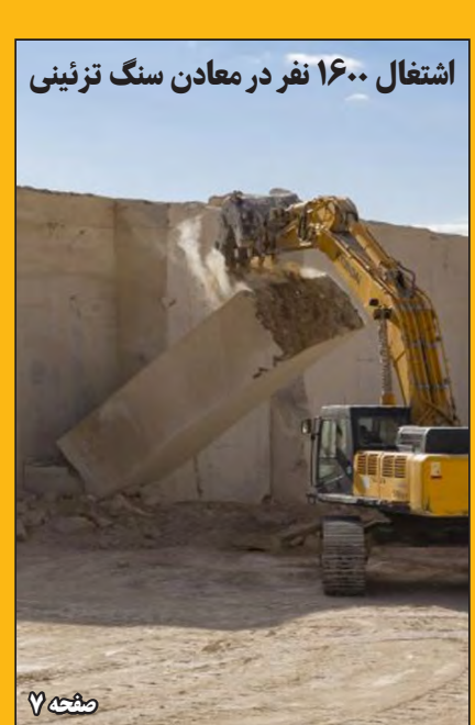
اشتغال ۱۶۰۰ نفر در معادن سنگ تزئینی

جشنواره فجر انقلاب ویژه بچه‌های مسجد صفحه ۸