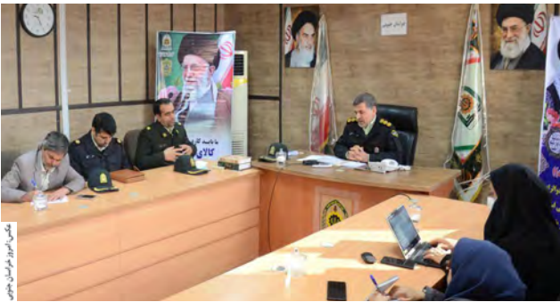
رئیس پلیس امنیت اقتصادی استان در جلسه

استان‌های همجوار و آن سوی مرز که باعث روی آوردن برخی افراد به این پدیده شده، تصریح کرد: در بحث قاچاق فرآورده های نفتی در استان به دو صورت و توسط خودروهای سنگین و یا سواری صورت می گیرد که در بخش خودروهای سنگین(تریلر، تانکر، کامیون و اتوبوس) امسال تعداد خودروهای توقیف شده با ۱۰۰ درصد افزایش نسبت به مدت مشابه سال قبل با ۱۰۰ درصد افزایش به ۳۰۱ دستگاه رسید.