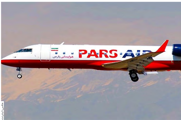
عمده هواپیماهای موجود بدنه متوسط به بالا در خط پروازی عتبات به کار گرفته می شوند این ظرفیت مسافری، مناسب زائران استان خراسان جنوبی انجام شده پارس ایر میزبانی زائرین

امروز خراسان جنوبی - صادقی پروازهای عتبات عالیات از فرودگاه بیرجند دوباره برقرار شد و از این پس سه شنبه ها انجام می شود. مدیرکل فرودگاه های استان خراسان جنوبی گفت: با تلاش استاندار، حج و زیارت استان و این اداره کل رایزنی های انجام شده برای برقراری دوباره پروازهای عتبات از مرکز استان به نتیجه رسید.