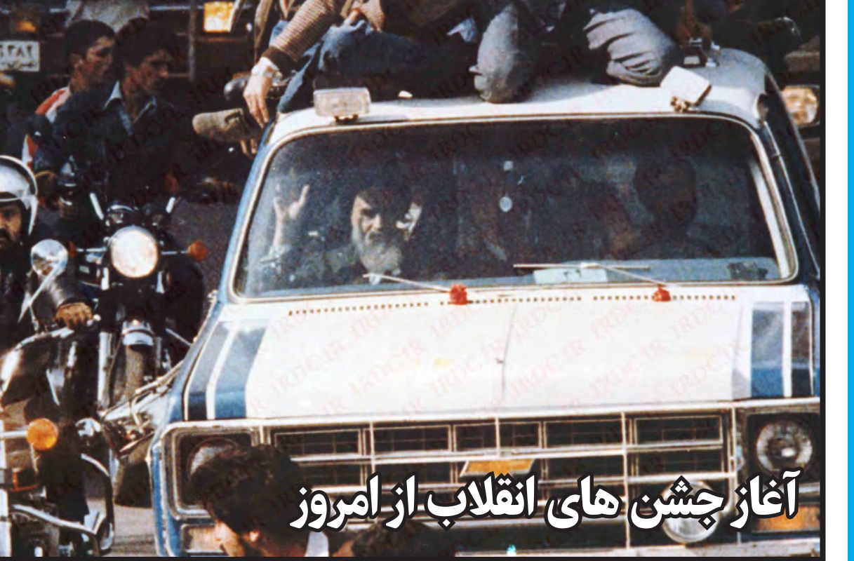
آغاز جشن های انقلاب از امروز