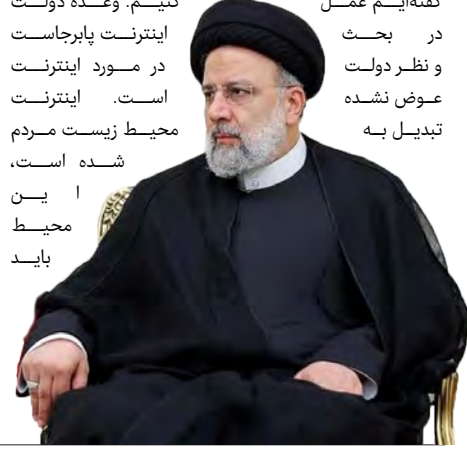
سید محمد حسینی، معاون پارلمانی رئیس‌جمهور گفت: امروز با ۱۰۰ بانک روسی ارتباط داریم و از این طریق با ۱۳ کشور ارتباط بانکی برقرار کردیم که این موضوع قطعاً منشأ درآمد برای کشور است. اصلاح ساختار معیوب اقتصادی کشور مهم‌ترین هدف در اولویت نخست دولت سیزدهم است.