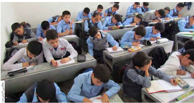
مدیرکل آموزش و پرورش خراسان جنوبی با کمبود فضای آموزشی مواجه است طوری که سرانه آموزشی استان ۵۰ درصد کمتر از میانگین کشوری است. کمبود نیرو هم در این وضعیت قوز بالا قوز شده و چالش‌هایی ایجاد کرده است.

امسال ۱۲۵۹ نفر بازنشسته شده‌اند و طراز نیروی انسانی نشان می‌دهد کمبود جمعیت نغری را خواهیم داشت؛ بنابراین تقاضا داریم راهکاری در این خصوص ارائه شود. وی پراکندگی بالا را از مشکلات دانسته و گفته بود: کثرت معلمان بانو یک چالش بزرگ است چرا که پراکندگی و تقاضاها زیاد و نزدیکی محل خدمت و زندگی درخواست همه است.