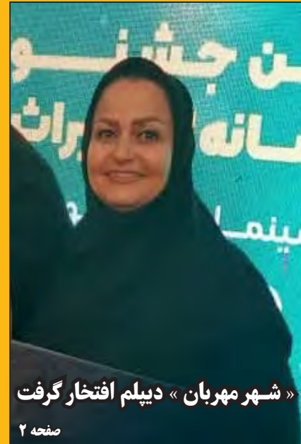
«شهر مهربان» دیپلم افتخار گرفت

هنری که نذر همدلی شد گره عشق بر تار و پود قالی قهستان قیمت ۲۵۰ هزار تومانی گوشت گرم گوسفندی منطقی است ۶۸۲ خانوار عشایری برق خورشیدی دارند رتبه اول استان در رویداد ملی مدیریت بحران پیش از پایان سال یک میلیون شغل ایجاد کردیم راه اندازی بازارچه صنایع دستی نوری در خوسف صدور ۲۹۰۰ سند مالکیت برای روستائیان