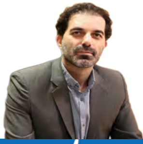
اشتغال ۷۰۰ نفر در محدوده طلایی استان

هنری که نذر همدلی شد گره عشق بر تار و پود قالی قهستان قیمت ۲۵۰ هزار تومانی گوشت گرم گوسفندی منطقی است ۶۸۲ خانوار عشایری برق خورشیدی دارند رتبه اول استان در رویداد ملی مدیریت بحران پیش از پایان سال یک میلیون شغل ایجاد کردیم راه اندازی بازارچه صنایع دستی نوری در خوسف صدور ۲۹۰۰ سند مالکیت برای روستائیان