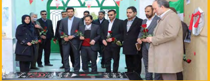
سفر دوروزه معاون وزیر علوم و رئیس سازمان امور دانشجویان به خراسان جنوبی