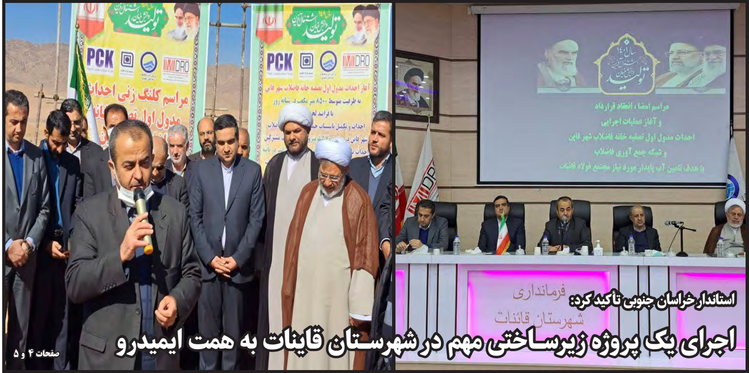
اجرای یک پروژه زیرساختی مهم در شهرستان قاینات به همت ایمیدرو