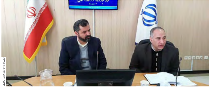
معاون سیاسی، امنیتی و اجتماعی استاندار خراسان جنوبی (راست) در نشست تخصصی با مدیرکل بهداشت خراسان جنوبی (چپ) در مشهد.

معاون سیاسی، امنیتی و اجتماعی استاندار خراسان جنوبی هم در این نشست گفت: علی رغم اینکه مرکزی برای درمان اجباری اعتیاد در استان راه اندازی شده اما مورد تأیید کمیته کشوری درمان اعتیاد نیست لذا این موضوع باید به شکل جدی تعیین تکلیف شود.