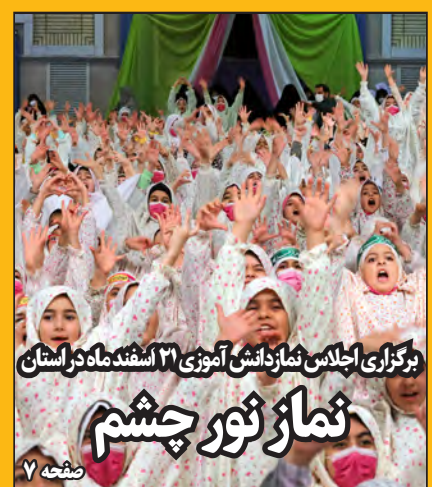
برگزاری اجلاس نمازگزاران آموزی ۱۲ اسفندماه در استان نماز نور چشم صفحه ۷

داستان استان: با تاراج ثروت استان بر خورد جدی می شود