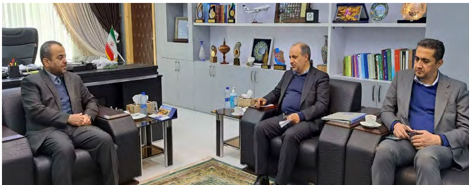
کلیدی برای شهرستان قاینات است که همه باید سعی کنیم هر چه زودتر به سرانجام برسد.