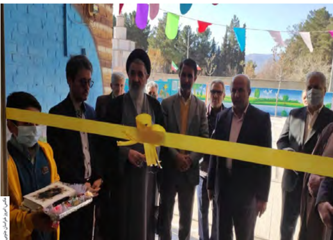
در دانش آموزان دوره ابتدایی و پرورش قدرت تفکر و حل مسئله و ... طرح پروژه های علمی موسوم به جشنواره جابرین حیان در دبستان علامه حلی ۱ اجرا شده است.