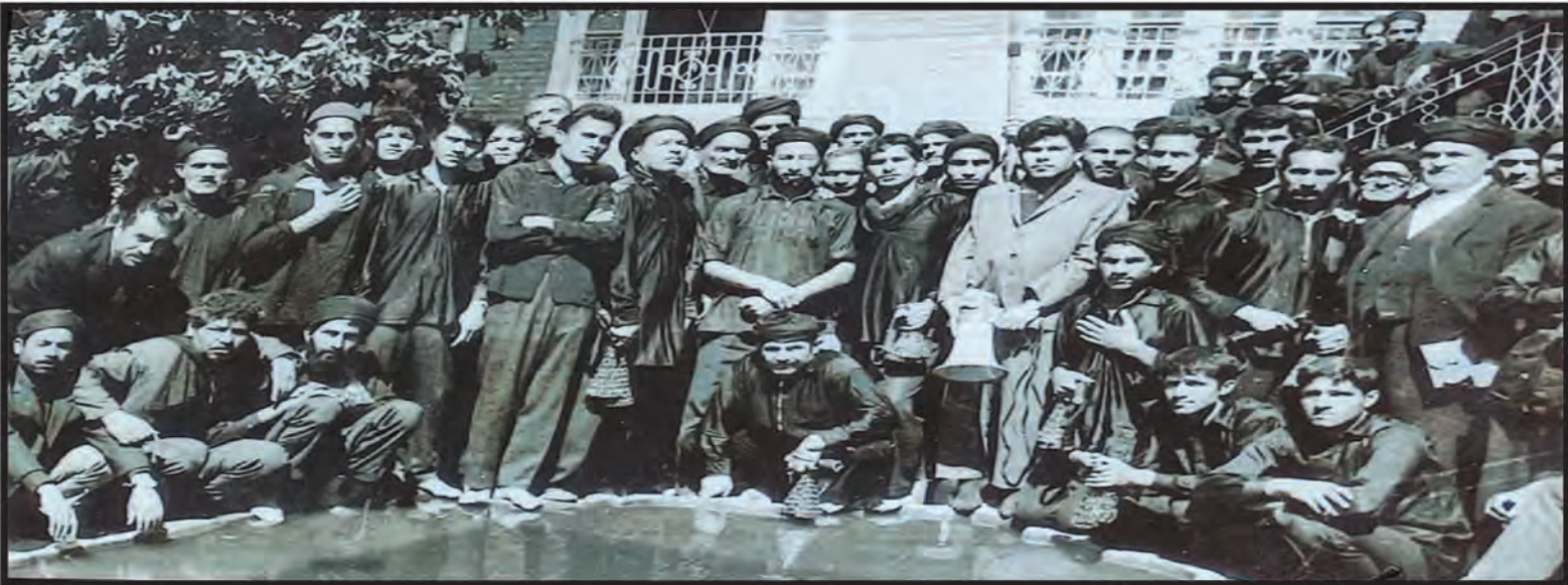
اینجا همه مفتخر به خادمی ابوالفضل (ع) شدند