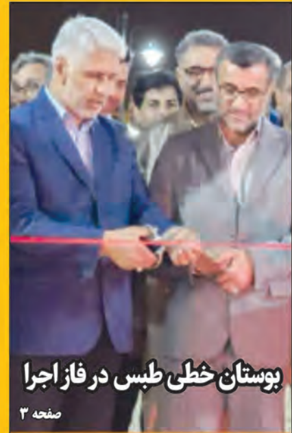
بوستان خطی طبس در فاز اجرا