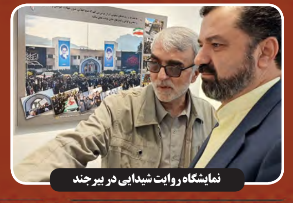
نمایشگاه روایت شیدایی در بیرجند