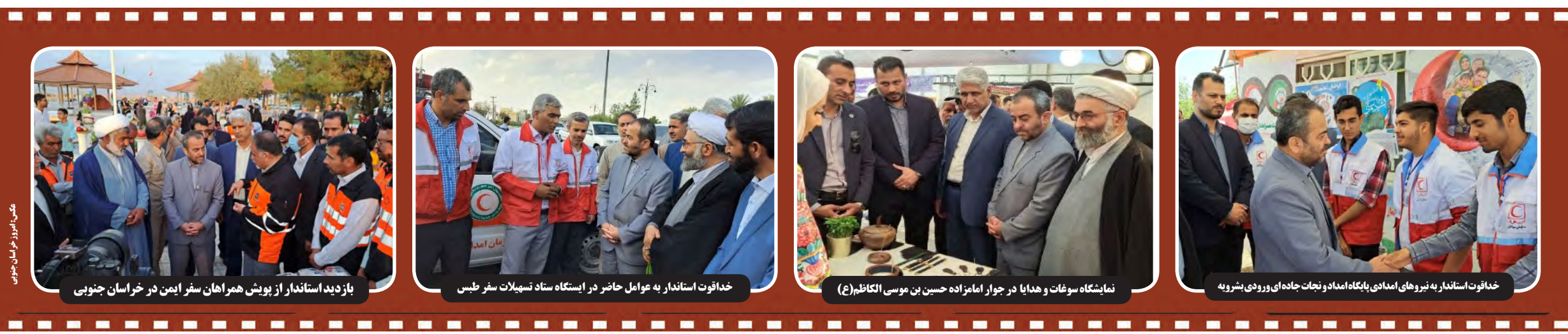
خداقوت استاندار به نیروهای امدادی پایگاه امداد و نجات جاده ای ورودی بشروه / نمايشگاه سوغات و هدايا در جوار امامزاده حسين بن موسی الكاظمی (ع) / خداقوت استاندار به عوامل حاضر در ایستگاه سدا سبیلات سفر طبس / بازدید استاندار از پوشش همراهان سفر امین در خراسان جنوبی