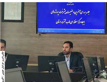
کتابخانه تخصصی پرورش شتر خراسان جنوبی

اشرفی تصریح کرد: ستاد اجرایی فرمان حضرت امام (ره) در این راستا با پرداخت ۲۵۰ میلیارد تومان تسهیلات به متقاضیان طی ۲ سال گذشته، بیش از هزار نفر شتر و ۴۰ هزار رأس دام سبک وارد استان کرده است که توانسته به ارزش افزوده و تکمیل این زنجیره کمک