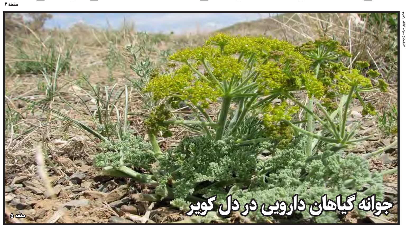
جوانه گیاهان دارویی در دل کویر صفحه ۵

دستیار رئیس جمهور در امر مردمی سازی دولت گفت: بسیاری از الگوهای مردمی کردن دولت را امروز شاهد هستیم به طوری که مردم با استفاده از ظرفیت و توان خود حتی وارد حیطه عمرانی شده اند و هزینه ها به نصف کاهش یافته است. سید احمد عبودتیان در اولین نشست شورای اداری استان خراسان جنوبی در سال جدید که در سالن شهید رجایی استانداری برگزار شد، افزود: در همه حوزه های کشور مسائل و مشکلاتی وجود دارد که در مقابل محدودیت منابع مالی و انسانی استفاده از ظرفیت های مردمی ضروری است. وی امنیت را از دیگر مؤلفه های حضور مردم برشمرد و گفت: نقش آفرینی مردم در این عرصه ها از الگوهای امام راحل بوده است. دستیار رئیس جمهور در امر مردمی سازی دولت ادامه داد: برای مردمی سازی دولت، ایمان داشتن حکمرانان و تأمین زیرساخت های قانونی الزامی است لذا برای به میدان آوردن مردم برای ایجاد حرکت عمومی باید همه مدیران پای کار باشند. وی گفت: گروه های مردمی با تمرکز بر موضوعات می توانند ضمن مطالبه گری از حاکمیت مشکلات را حل کنند و باید مدیران هم به این موضوع ایمان بیاورند. عبودتیان افزود: الگوی موفق در دهه های مختلف، فراگیرسازی فرمول مردمی کردن امور است لذا باید حضور مردم در تصمیم سازی، اجرا و نظارت تضمین شود.