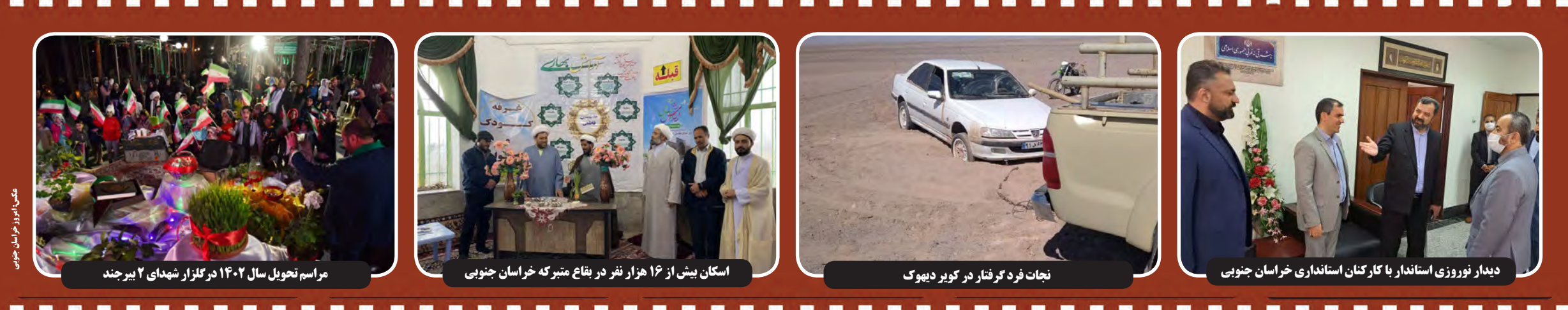
مراسم تحویل سال ۱۴۰۲ در گلزار شهدای ۲ بیرجند

دست اندرکاران امر تعلیم و تربیت در کشور، کسر بزرگی از جمعیت کشور را شامل می شود. هسته مهم در شکل گیری آن معلمان هستند. آموزگاران که امسال را با دغدغه هایی عجیب آغاز کردند و تلاش داشتند پاسخ این پرسش را بیابند، به راستی چه کسی مقصر بوده که در پرداخت مطالبات و دستمزدشان خللی این اندازه بزرگ به وجود آمده و چه عاقبتی متوجه مقصر یا مقصرین خواهد شد؟ سوالی که با صدور دستور ویژه رئیس جمهور به معاون اولش برای بررسی این مساله عجیب، پیگیری آن در بالاترین سطح در دستور کار قرار گرفت. آن گونه که در ابتدا به نظر می رسید، اختلاف میان بخش هایی از این وزارت خانه و سازمان برنامه و بودجه موجب بروز این وضعیت غیرقابل پذیرش شده بود، اما یوسف نوری، وزیر آموزش و پرورش روایت متفاوتی مطرح می کرد: «تاخیر در پرداخت حقوق اسفند فرهنگیان به دلیل اختلاف در محاسبه رتبه بندی بود، زیرا در مبنای محاسبه اختلاف به وجود آمد که بخشی از آن به قانون و بخشی از آن به کمبود اعتبار مربوط بود.» این اظهاراتی است که وزیر با حضور در رسانه ملی به فاصله چند ساعت مانده به تحویل سال بیان و تأکید کرد: «از چهارشنبه هفته گذشته، بحث تأخیر در واریز حقوق را مطرح کردیم؛ در هیات دولت هم رئیس جمهور دستور اکید داشتند که این مشکل حل شود. در این مدت به توافق نرسیدیم و لذا برای حقوق اسفند در واریز اختلال به وجود آمد؛ توضیحاتی که در تکمیلش یادآوری کرد در مسیر رفتن به بانک مرکزی است تا شبانه مشکل به وجود آمده را رفع کند.»