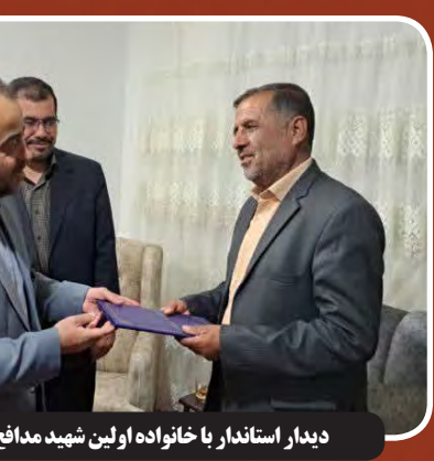
دیدار استاندار با خانواده اولین شهید مدافع حرم استان