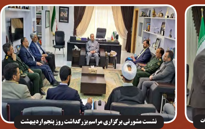
نشست مشورتی برگزار می شود مراسم بزرگداشت روز پنجم اردیبهشت