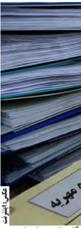
فته‌های گل وقتی وارد فهرست تعدادشان به طرز غیرقابل زنی جوانی که ۲۵ هزار شاخه گل در دادگاه خانواده شهید محلاتی