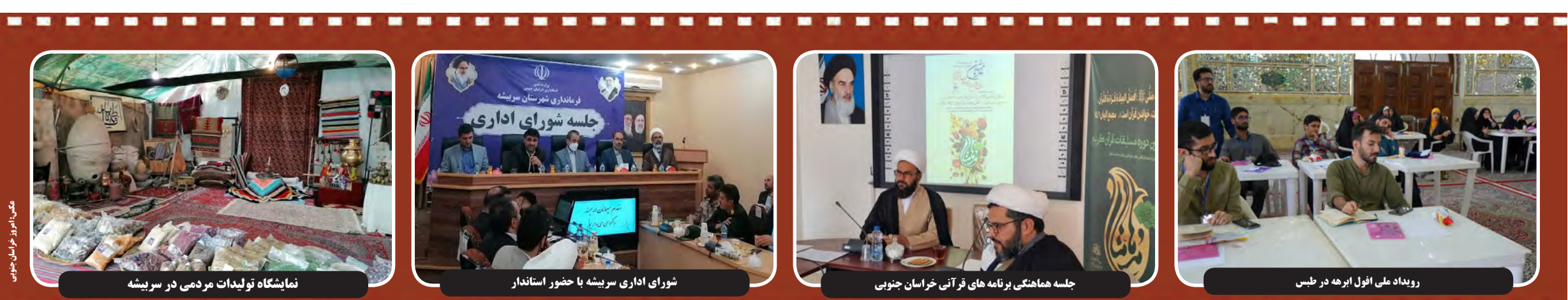
نمایشگاه تولیدات مردمی در سرپیشه / شورای اداری سرپیشه با حضور استاندار / جلسه هماهنگی برنامه‌های قرآنی خراسان جنوبی / رویداد ملی افول ابرهه در طبس