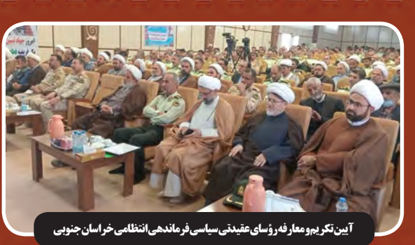
دیدار دبیر شورای فرهنگ عمومی کشور با استاندار خراسان جنوبی