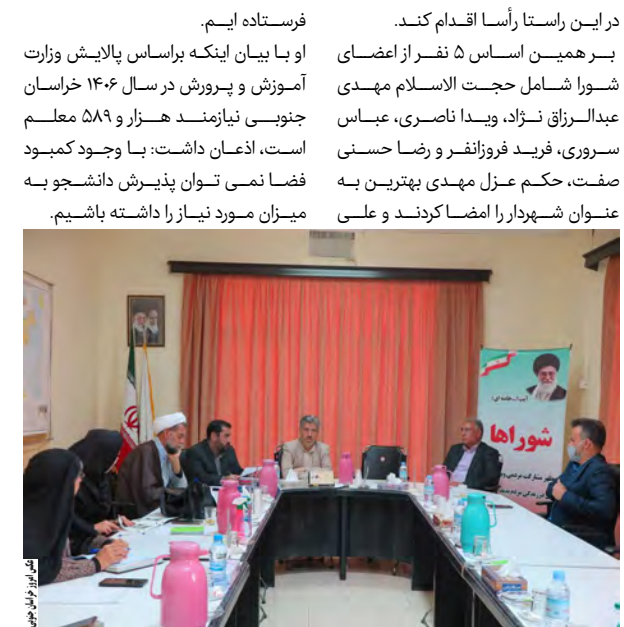
عدل به عنوان سرپرست شهرداری انتخاب شد.

عدل به عنوان سرپرست شهر داری بیرجند معرفی شد