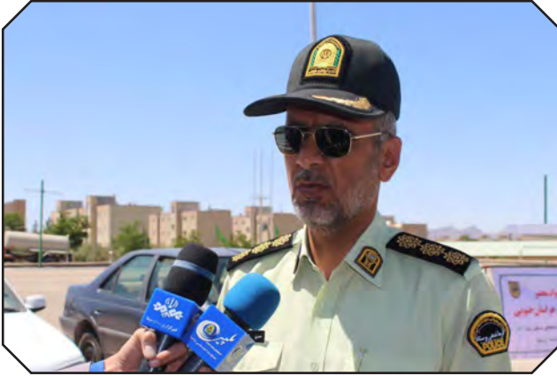
دستگیر و ۱۶ دستگاه خودروی قاچاقچیان را نیز توقیف نمودند. سرهنگ شجاعی نسب با بیان

فرمانده انتظامی خراسان جنوبی از متلاشی شدن ۹ باند قاچاق و توزیع مواد مخدر و دستگیری اعضا و افراد مرتبط با آنها از ابتدای سال جاری خبر داد. سرهنگ شجاعی نسب روز گذشته در جمع خبرنگاران با ذکر اینکه مقابله با مواد مخدر به ویژه در استان‌های مرزی از جمله خراسان جنوبی، موضوعی جدی و بسیار حائز اهمیت است، گفت: استان مرزی خراسان جنوبی از استان‌هایی است که به عنوان محل عبور محموله‌های قاچاق مواد مخدر توسط قاچاقچیان، مورد استفاده قرار می‌گیرد، لذا مقابله با قاچاق مواد مخدر از اولویت‌های مأموریتی مأموران انتظامی استان‌های مرزی کشور و استان خراسان جنوبی است.