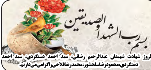
سالروز شهادت شهیدان عبدالرحیم رضائی، سید احمد دستگردی، سید احمد دستگردی، محمود فاضلخسروشور، محمدرضاخاوری اگرامی می ناریم.

و درود خدا براو ، فرمود: شایسته نیست به سخنی که از دهان کسی خارج شد، گمان بد ببری ، چرا که برای آن برداشت نیکویی می توان داشت.