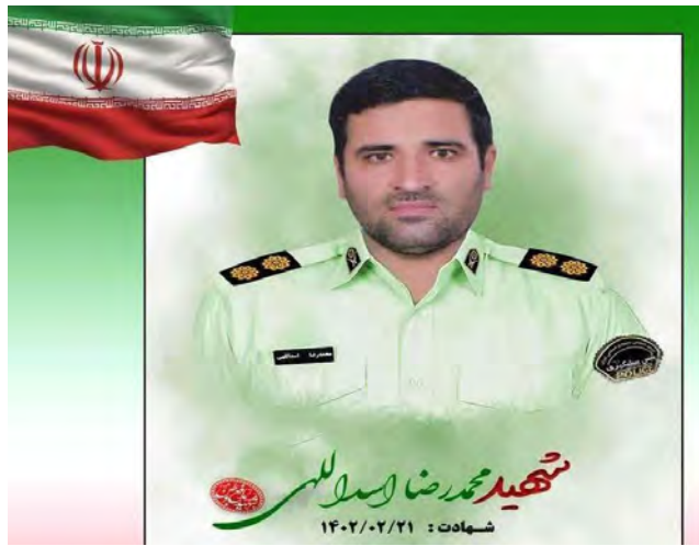
است که همواره برای رسیدن به معبود برای خدمت به مردم ... برای عزت و سربلندی کشور

ایشان و از خودگذشتگی زیننده انسان‌های فداکار و جان برکفشی تلاش و مجاهدت می‌کنند و در این راه از جان خود می‌گذرند