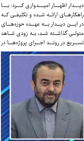
دستور ویژه رئیس جمهور برای خراسان جنوبی

امروز خراسان جنوبی - صالحی استاندار در پایتخت برای ارائه گزارشی از اقدامات انجام شده در استان از فرصت نماز بهره گرفت و دیداری با رئیس جمهور ترتیب داد. در این دیدار رئیس دولت برای تحرک بخشیدن و تسریع در اجرای طرح های خراسان جنوبی دستوراتی ویژه به استاندار داد. استاندار در تشریح این دیدار گفت: گزارشی از طرح های در دست اقدام دولت در استان خراسان جنوبی به رئیس جمهور ارائه و در این دیدار تأکید شد که طرح های ملی و پروژه های در دست اقدام با قوت پیگیری و اجرا شوند. جواد قناعت آخرین اقدامات و برنامه های استان را برای وی تشریح کرد و با ارائه گزارش جامعی از طرح های در دست اقدام دولت در استان خراسان جنوبی، از اقداماتی گفت که در راستای جذب سرمایه گذار به منظور استفاده از ظرفیت های موجود انجام شده است.