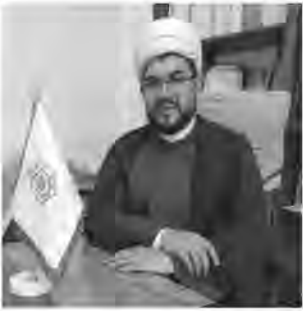
دز مراسم شهادت امام صادق(ع) در بین هیئت ها خیرداد.

۶۰۰هزار بطری آب معدنی از محل موقوفه آبلوله در طول یک سال گذشته خریداری و بین مردم بیرجند توزیع شد. رئیس اداره اوقاف و امورخیریه بیرجند اجرای نیات واقفین را از میناهای قانونی و شرعی متولیان موقوفات دانست و گفت: در سطح شهر بیرجند ۸-باب ستاقخانه (پارک نیلوفر، روستای علی آباد، ظفر، الهیه، مهرشهر، مطهری، معصومیه) از محل موقوفه آبلوله برای خدمات رسانی مطلوب به مردم بیرجند از سوی اوقاف احداث که احیا و اجرای دقیق