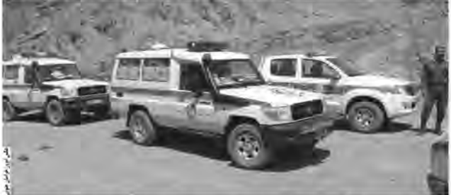
مسافر بشرویه دریافت شد که بلافاصله ارتفاعات روستای گزو از توابع چاه

امروز خراسان جنوبی- گروه حوادث سقوط از ارتفاعات در شهرستان بشرویه باعث مصدومیت شدید یک نفر شد. رئیس جمعیت هلال احمر بشرویه از انجام عملیات امدادرسانی به مصدوم حادثه سقوط از ارتفاعات مرز شهرستان های بردسکن و بشرویه خبر داد.