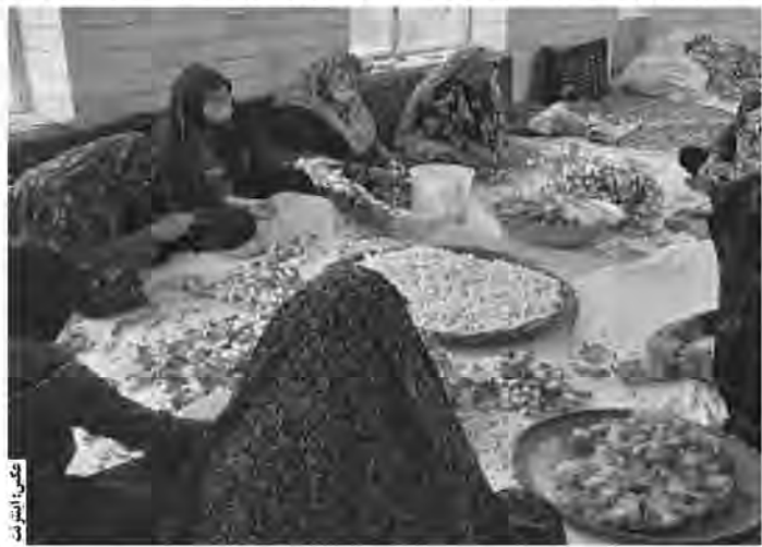
امسال ۱۵ جعبه نوغان تحویل گرفته است؛ گفت: طول دوره نوغانداری از یک ماه تا ۴۵ روز متغیر است. او افزود: در سه نوبت صبح، ظهر و عصر نوغانداری می شود.

به گزارش باشگاه خبرنگاران جوان، سیدی از نوغانداران فردوسی که