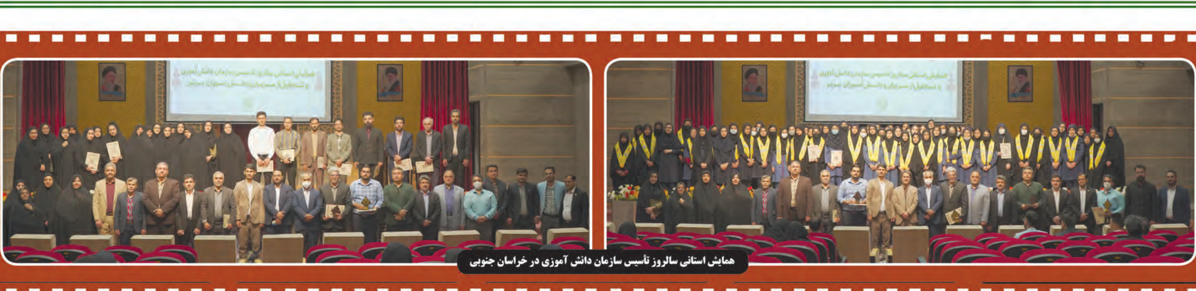
همایش استانی سالروز تأسیس سازمان دانش آموزی در خراسان جنوبی