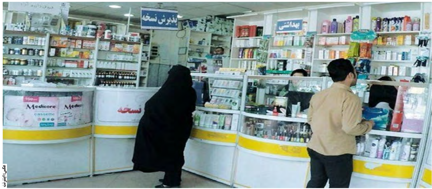
در کل کالاهای اساسی به ویژه بخش دارو تا بیش از ۵۰ درصد بود.

تومان نمی شد. یکی دیگر از مراجعہ کنندگان به داروخانه داروهای مسالغ) یک پماد برای خشکی پوست کودک ۸۰ هزار تومان (نرخ آزاد) از دیگر درد دل های مراجعہ کنندگان به چند داروخانه سطح شهر بود. ۹۰ هزار تومان شده که واقعا برایم جای تعجب داشت چرا که نسبت به قبل مثلا سال گذشته خیلی گران تر شده بود. تومان نمی شد. یکی دیگر از مراجعہ کنندگان به داروخانه داروهای مسالغ) یک پماد برای خشکی پوست کودک ۸۰ هزار تومان (نرخ آزاد) از دیگر درد دل های مراجعہ کنندگان به چند داروخانه سطح شهر بود. ۹۰ هزار تومان شده که واقعا برایم جای تعجب داشت چرا که نسبت به قبل مثلا سال گذشته خیلی گران تر شده بود.