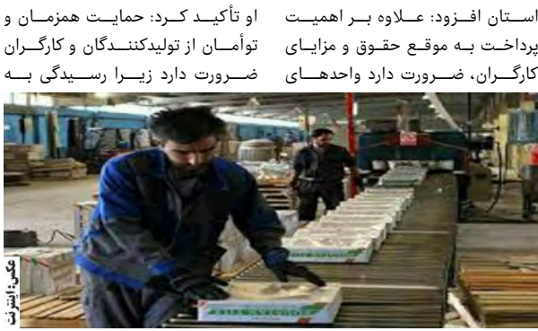
تولیدی به مسئولیت های اجتماعی و فرهنگی خود عمل کنند.

امروز خراسان جنوبی - گروه خبر ضرورت دارد کارفرمایان واحدهای تولیدی روحیه نشاط و شادابی در کارگران ایجاد کنند. معاون استاندار خراسان جنوبی گفت: مدیران واحدهای تولیدی باید با حمایت از فعالیت های فاخر هنری استان، برنامه های فرهنگی و هنری متنوع و مناسبی را برای کارگران پیش بینی کنند که قطعا در ایجاد روحیه نشاط در کارگران و افزایش بازدهی کار مؤثر خواهد بود. سید محمد رضا طالبی در نشست کمیسیون کارگری شورای تأمین