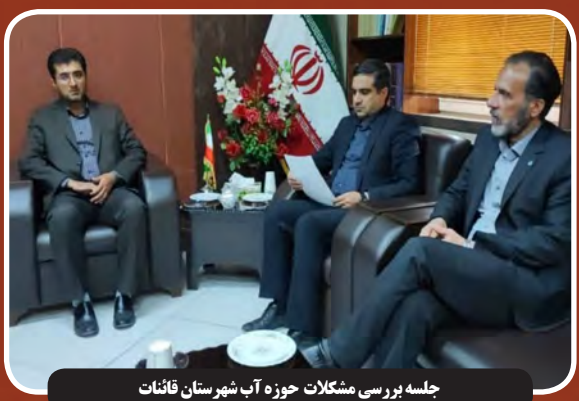
جلسه بررسی مشکلات حوزه آب شهرستان قانات