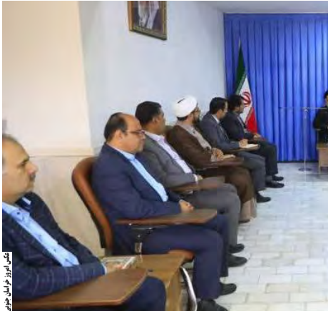
حجت الاسلام والمسلمین علیرضا عزیزی در دیدار با اعضای هیئت رئیسه دانشگاه آزاد اسلامی خراسان جنوبی

دکتر سید حسن هاشمی با اشاره به اینکه دانشگاه آزاد اسلامی به جایگاهی فاخر در سطح ملی و بین المللی رسیده گفت: قطعا این دانشگاه با سند تحول و تعالی و با همت و تلاش مسئولان و همکاران ارجمند این مجموعه و در سایه سار ولایت در جهت نیل به اهداف متعالی نظام مقدس جمهوری اسلامی موفق خواهد بود.