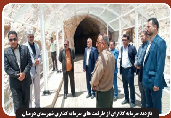
بازدید سرمایه‌گذاران از ظرفیت های سرمایه گذاری شهرستان در میان