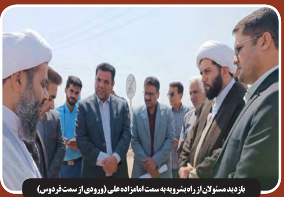
بازدید مسئولان از راه‌پنرویه به سمت امامزاده علی (ورودی از سمت فردوسی)