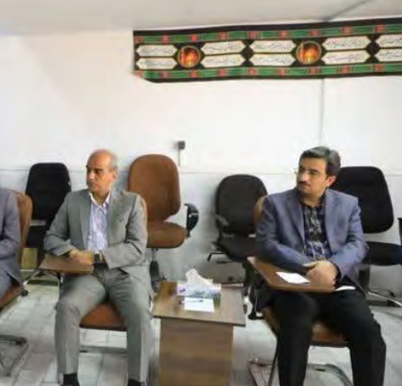
حجت الاسلام والمسلمین علیرضا عزیزی در دیدار با اعضای هیئت رئیسه دانشگاه آزاد اسلامی خراسان جنوبی

وی تأکید کرد: در چنین شرایطی مسئولان حوزه و دانشگاه باید در قالب تبیین که حضرت آقا فرمودند اقدام اساسی انجام دهند تا برای نسل جوان ایهامی نماند و این شرایط مساعد و فرصت فوق طلایی که بشر