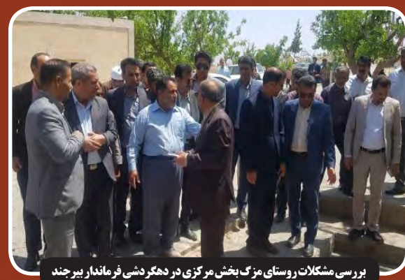
بررسی مشکلات روستای مزک بخش مرکزی در دهگر دشتی فرماندار بیرجند

تشدید تحریم‌های نفتی علیه ایران مایک لارو و جرد موسکوویتز، دو قانونگذار جمهوری خواه آمریکایی، طرحی را ارائه کردند که در آن به دنبال وضع تحریم‌های جدید علیه افرادی است که به ایران برای دور زدن تحریم‌های آمریکا در زمینه صادرات نفت کمک می‌کنند. پایگاه خبری جوینش اینسایدر درباره این طرح نوشت: بر اساس طرح «قانون توقف کمک به نفت ایران» که به وسیله این دو جمهوری خواه ارائه شده است، رئیس‌جمهور آمریکا قادر است، تحریم‌هایی را علیه گروهی از افراد و نهادهای خارجی که آگاهانه در کمک به صادرات نفت ایران مشارکت دارند، وضع کند.