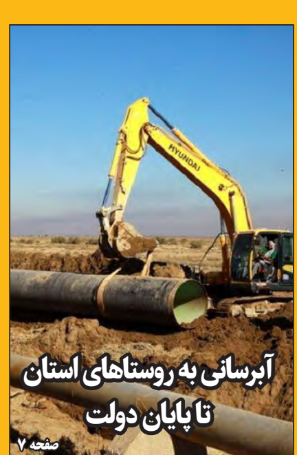
عکس: امروز، خراسان جنوبی

شهرداری بیرجند در تولید بتن بی نیاز می شود صفحه ۴