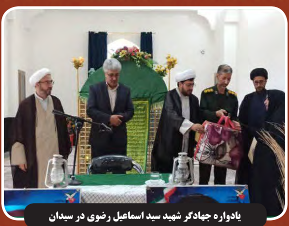
یادواره جهادگر شهید سید اسماعیل رضوی در سیدان