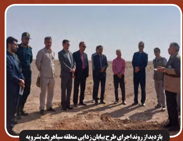
بازدید از روند اجرای طرح بیابان زدایی منطقه سیاهریگ بشرویه