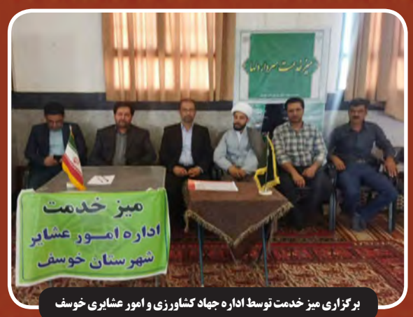
برگزاری میز خدمت توسط اداره جهاد کشاورزی و امور عشایر خوسف