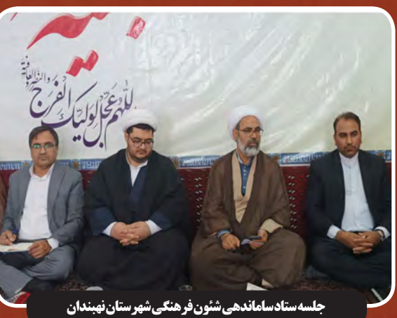
جلسه ستاد ساماندهی شئون فرهنگی شهرستان نهبندان