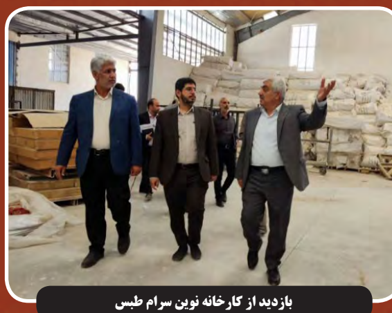
بازدید از کارخانه نوین سرام طمس