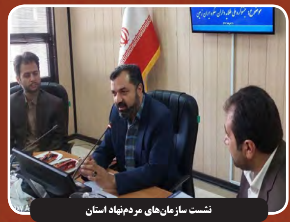
نشست سازمان های مردم نهاد استان