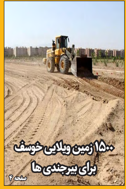
۱۵۰۰ زمین ویلایی خوشف برای بیرجندی ها صفحه ۴