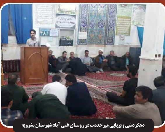
دهگردشی و برپایی میز خدمت در روستای غنی آباد شهرستان بشرویه