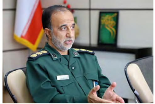
کیفیت کتاب های حوزه دفاع مقدس با هدف ارتقای فرهنگ، منوط به تأمین اعتبار و حمایت جدی استانداری و سازمان مدیریت و برنامه ریزی است.

مسابقات تیمی زورخانه‌ای رده سنی بزرگسالان کشور در دهه دوم تیرماه به میزبانی استان خراسان جنوبی در بیرجند برگزار خواهد شد. به گزارش روابط عمومی فدراسیون زورخانه‌ای و کشتی پهلوانی، این رقابت‌ها در گروه سنی بزرگسالان ۱۸ تا ۴۰ سال که متولدین ۱۳۶۲ تا ۱۳۸۳ را شامل می‌شود، پیگیری خواهد شد. بر همین اساس هیئت‌های استانی می‌توانند تا پایان وقت اداری روز دوشنبه مورخ ۵ تیرماه ۱۴۰۲ نسبت به اعلام آمادگی و ارسال لیست نفرات و همچنین ثبت نام در سامانه بانک اطلاعات فدراسیون به نشانی الکترونیکی www.pahlevani-fed.ir کد شناسه (۲۰۲۳۵۹۳۷۶۰۲۱۲۲۷۱۱۳۶۸۶) اقدام لازم را به عمل آورند. اصل شناسنامه و کارت ملی، کارت بیمه ورزشی معتبر، معرفی نامه از اداره کل ورزش و جوانان استان مربوطه، عکس پرسنلی جهت صدور ID کارت و ارائه مدارک ثبت نام در سامانه جامع بانک اطلاعات ورزشکاران فدراسیون به نشانی الکترونیکی www.pahlevani-fed.ir از مواردی است که شرکت کنندگان باید هنگام ثبت نام ارائه دهند. مسابقات بر اساس آخرین مقررات و قوانین فنی زورخانه‌ای و مرشدی فدراسیون زورخانه‌ای و کشتی پهلوانی برگزار می‌شود و هر استان می‌تواند ۵ نفر ورزشکار، یک نفر ذخیره، یک نفر مرشد، یک نفر مربی به همراه یک نفر سرپرست معرفی کند که مجموع نفرات تیم ۹ نفر است.