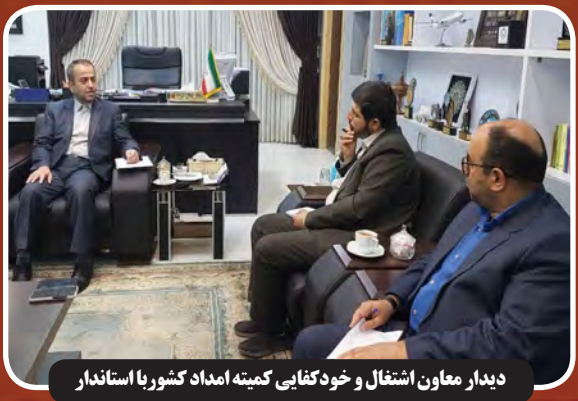
نشست صمیمی فرماندار یسرویه با بازاریان و کسبه شهرستان