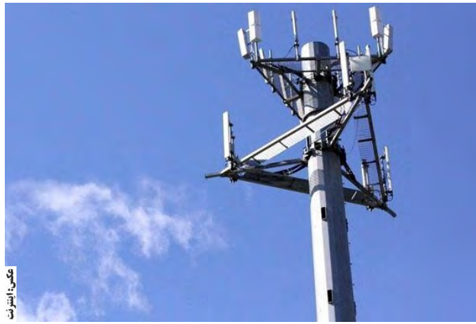
سایت نسل پنجم

او اظهار کرد: یک سایت دیگر نسل پنجم شبکه تلفن همراه نیز تا سه ماه آینده در منطقه نیروی هوایی بیرجند با اعتبار بیش از پنج میلیارد تومان و با همکاری شرکت ایرانسل راه‌اندازی خواهد شد. بهی گفت: هم اکنون ۸۰ درصد روستاهای بالای ۲۰ خانوار و تمامی شهرهای استان به شبکه ملی ارتباطات متصل هستند. مدیرکل ارتباطات و فناوری اطلاعات خراسان جنوبی تصریح کرد: پهنای باند ورودی به استان که از سوی شرکت ارتباطات زیرساخت تأمین می‌شود، حدود ۱۸۰ گیگابیت بر ثانیه است و اکنون بیش از ۷۰ درصد ظرفیت پهنای باند ورودی استان خالی است و استفاده نمی‌شود. یعنی به هر ظرفیتی که مردم از اینترنت استفاده کنند، پهنای باند آن در خراسان جنوبی موجود است.