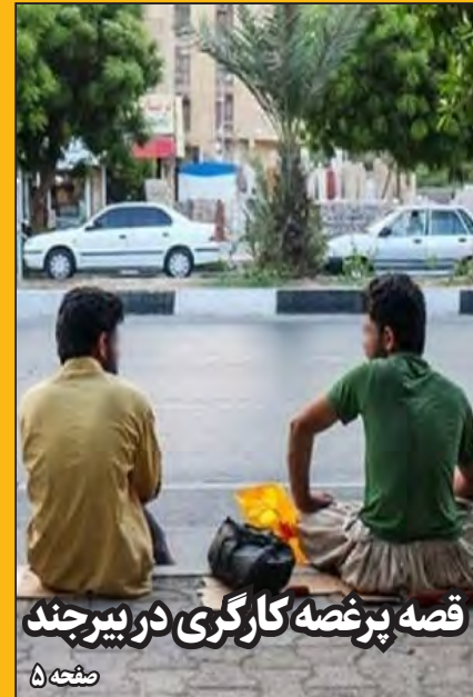
قصه پرغصه کارگری در بیرجند

اولین بازارچه تخصصی گوهر تراشی در روستای ملی سنگ های قیمتی و نیمه قیمتی خور احداث می شود