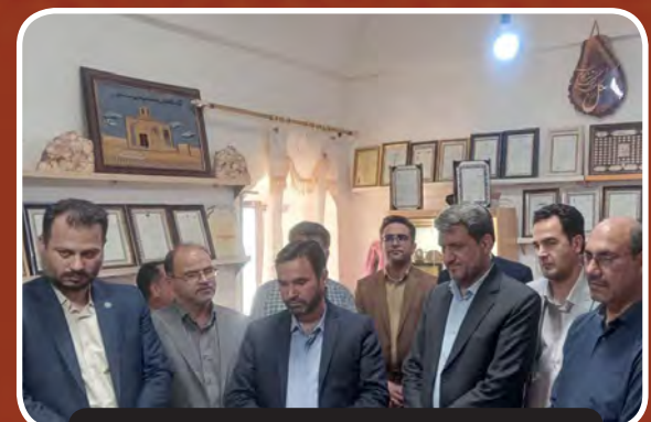
بازدید از کارگاه و نمایشگاه گوهر تراشی خور