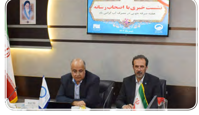
نشست خوری با اصحاب رسانه جلسه سرفه چوبی در حضور آب گرامی

وی با اشاره به اینکه تاکنون در ۸۵ درصد چاه های کشاورزی، شرب و خدمات استان کنتور هوشمند نصب شده است، بیان کرد: تاکنون این کنتورها بر روی ۱۰۰ درصد چاه های کشاورزی استان نصب شده و تنها در چاه های دیپلی و فاقد پتانسیل آبی نصب این کنتورها را نداشته ایم. وی اظهار داشت: از سال ۱۳۸۵ تاکنون هزار و ۲۰۰ حلقه چاه غیرمجاز را در استان مسدود کردیم. در سطح کشور میانگین برداشت از چاه های غیرمجاز ۳۰ درصد است در حالی که این رقم در خراسان جنوبی کمتر از سه دهم درصد است.