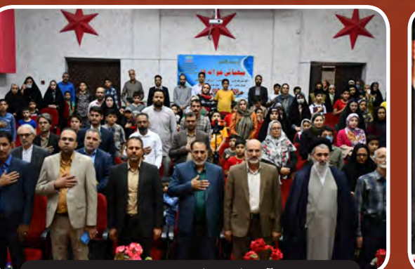
آیین افتتاحیه فعالیت های تابستانی