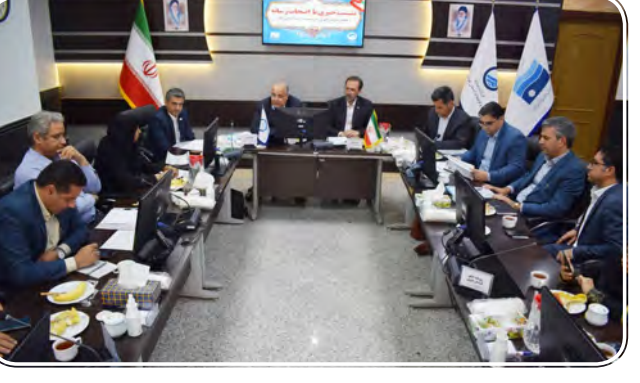
افتتاح اولین نگارخانه تخصصی آموزش و پرورش بیرجند

و طبس در وضعیت تنش آبی خبر داد و گفت: برای تأمین آب بیرجند ۲ حلقه چاه جدید حفر شده و چندین حلقه چاه نیز مهندسی مجدد انجام شده است.