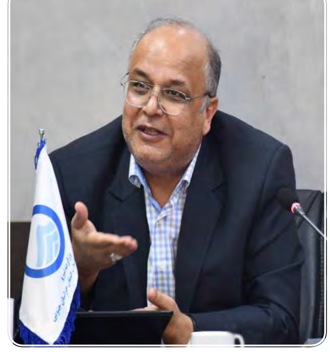
استان شرایط خوبی نداریم.