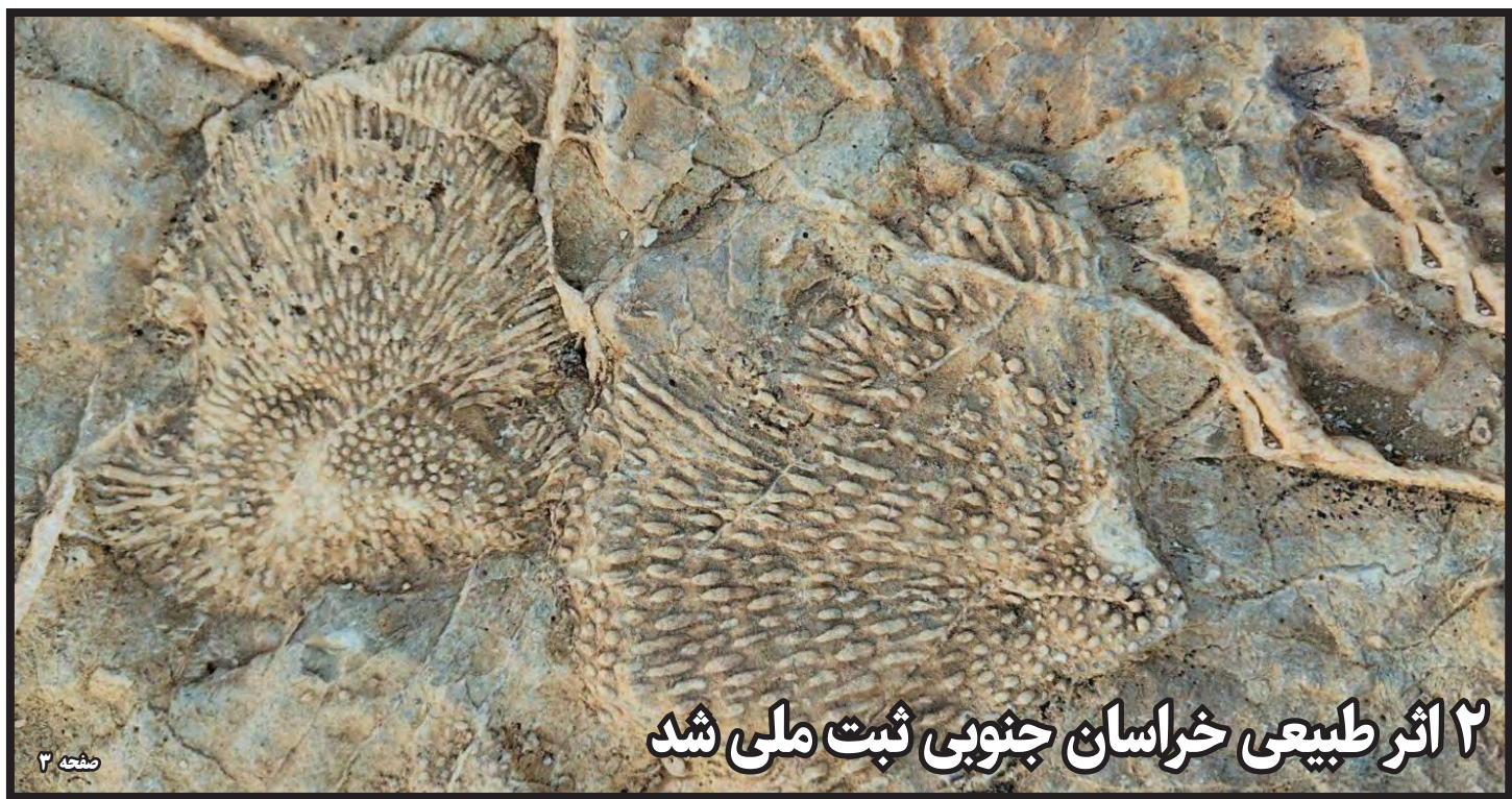
۲ اثر طبیعی خراسان جنوبی ثبت ملی شد