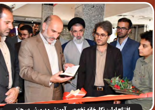
افتتاح اولین نگارخانه تخصصی آموزش و پرورش بیرجند