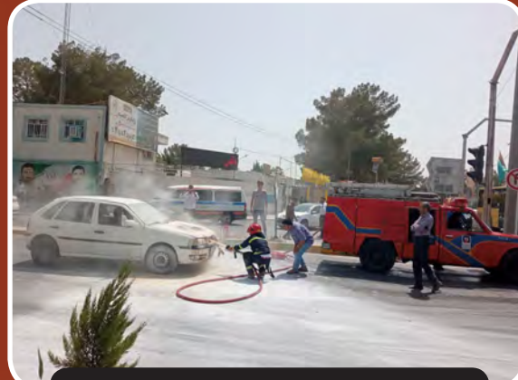
حریق خودروی فولکس در میدان ابودر بیرجند

لایحه الحاق مواد به قانون ساماندهی صنعت خودرو ماده واحده- متون زیر به عنوان مواد (۱۱) تا (۱۳) به قانون ساماندهی صنعت خودرو مصوب سال ۱۴۰۰ و اصلاحات بعدی آن الحاق می شوند: ماده ۱۱- به منظور تنظیم بازار خودرو، واردات خودروهای کارکرده از جمله اتوبوس مجاز می باشد. تبصره ۱- برای واردات این خودروها، انتقال فناوری موضوع بند (۲) و نیز بند (۳) ماده (۴) این قانون، لازم الزامی نیست. تبصره ۲- آیین نامه اجرایی این ماده مشتمل بر مواردی از جمله نحوه تأمین ارز مورد نیاز و حمایت از تولید داخل، ضوابط فنی این خودروها، عمر (کمتر از پنج سال) و نحوه احراز آن ها و شرایط واردات توسط اشخاص حقیقی و حقوقی و تعیین صلاحیت آنها، به پیشنهاد وزارت صنعت، معدن و تجارت با همکاری بانک مرکزی جمهوری اسلامی ایران، گمرک جمهوری اسلامی ایران، سازمان حفاظت محیط زیست و سازمان ملی استاندارد ایران، ظرف مدت یک ماه پس از لازم الاجرا شدن قانون تهیه و به تصویب هیات وزیران می رسد. وزارت صنعت معدن و تجارت مکلف است گزارش عملکرد این ماده را هر شش ماه به کمیسیون