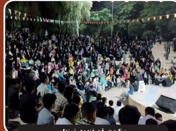
برنامه به وقت خنده در نهندان