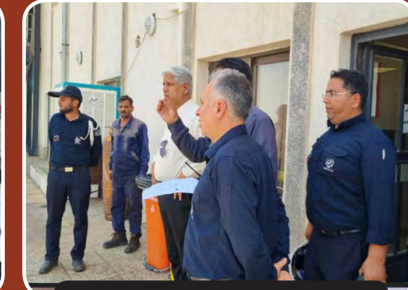
بازدید از کارگاه های شرکت گسترش و نوسازی معادن خاورمیانه