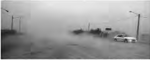
قرار گرفت. بر اساس داده های سامانه کیفی هوای کشور، شاخص لحظه ای کیفیت هوا در ساعت ۶ صبح دیروز در نهبندان به ۵۰۰ و وضعیت خطرناک

امروز خراسان جنوبی - صادقی وقوع طوفان و گرد و خاک در مرز شرقی خراسان جنوبی تا پایان هفته ادامه دارد. زارعی کارشناس هواشناسی گفت: مطابق با الگوی نقشه های پیش یابی هواشناسی تا پایان هفته کماتان گاهی وزش باد شدید و گرد و خاک در مرز سارانی احتمال طوفان و گرد و خاک قابل پیش بینی است.