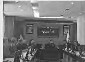
اینگونه گرافیک: امروز خراسان جنوبی

وی افزود: اجازه نخواهیم داد واحد تولیدی در سطح استان دچار مشکل و فرآیند تولید متوقف شود و مصوبات به دستگاه‌های اجرایی ابلاغ می‌شود و لازم الاجرا است. او ادامه داد: باید موانع پیش‌روی واحدهای تولیدی استان برای احیا و جهش تولید در دستور کار جدی مسئولان متولی قرار گیرد.