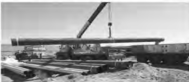
به گفته وی همچنین اعتبار مورد نیاز برای اجرای این طرح ۹۵ میلیارد تومان برآورد شد و قرار بود تا پایان سال ۱۴۰۰ به بهره برداری برسد. مدیرعامل شرکت آب منطقه ای خراسان جنوبی با اشاره به توقف این پروژه در چند سال اخیر افزود: علی رغم

طرح انتقال آب از دشت مختاران به شهر بیرجند به عنوان یک طرح راکد و نیمه تمام در دولت سیزدهم مورد توجه ویژه قرار گرفت و با اختصاص اعتبار لازم از ابتدای سال جاری مجدد فعال شد. مدیرعامل شرکت آب منطقه ای خراسان جنوبی گفت: عملیات اجرایی پروژه انتقال آب از دشت مختاران به بیرجند مرداد سال ۹۸ در سفر وزیر نیرو به خراسان جنوبی آغاز شد.