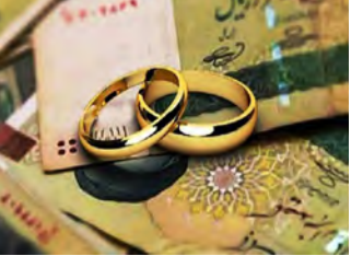
در سه ماهه نخست امسال ۱۸ هزار و ۸۳۰ میلیارد ریال تسهیلات ازدواج به زوج‌های جوان در خراسان جنوبی پرداخت شد. دبیر شورای هماهنگی بانک‌های خراسان جنوبی با اعلام این خبر گفت: این تسهیلات به هزار و ۹۱۲ تقاضای پرداخت شده است.

ز رنگ سقف پرداخت تسهیلات ازدواج را ۱۸۰ میلیون تومان اعلام کرد و افزود: سقف این تسهیلات برای متقاضیانی که زوج ۲۵ سال و زوجه ۲۳ سال سن داشته باشند ۲۰ میلیون تومان است. وی افزود: این تسهیلات قرض