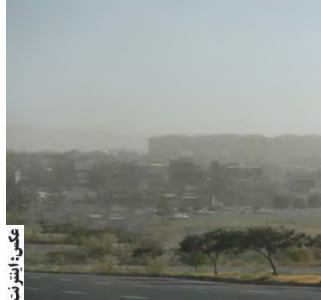
تلفظ: امروز خراسان جنوبی - رحیمی

هدف، برخوردار خواهند شد بیش از ۱۴هزار و ۷۸۸ نفر هستند. دوستی با اشاره به اینکه این پروژه ها با اولویت مناطق مرزی استان تعریف شده است، افزود: میتمم های آبرسانی که با اجرای این پروژه ها در استان احداث می شوند شامل مجتمع آرسک بشرویه، مجتمع القار، بهدان، پسوج، علی آباد، مزداب و آسو بیرجند، حامی دهن رود خوسف، خونیک چهارتنگ درمیان و فخرود درمیان است. بنابر اعلام مسئولان استان، آبرسانی به ۵۰۲ روستای استان با مشارکت قرارگاه امام حسن مجتبی (ع) تا پایان سال ۱۴۰۳ انجام می شود.