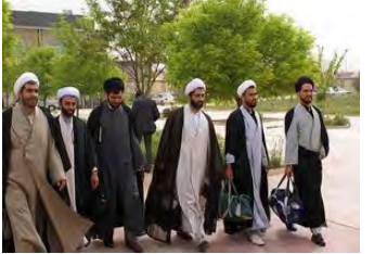
بیش از هزار مبلغ در دهه محرم به نقاط مختلف خراسان جنوبی اعزام شدند. معاون فرهنگی تبلیغات استان گفت: ۴۰۰ مبلغ از استان‌های قم و مشهد و ۸۰۰ مبلغ بومی، ائمه جماعات، روحانیون مستقر، هجرت و امین در شهرستان‌های مختلف استان حضور دارند.

حجت الاسلام قناعت افزود: با برنامه‌ریزی‌های انجام شده هیچ روستا و مسجدی در استان بدون روحانی نیست. وی گفت: جهاد تبیین، امیدآفرینی، توجه به کانون خانواده، انسجام و وحدت و پاسخگویی به