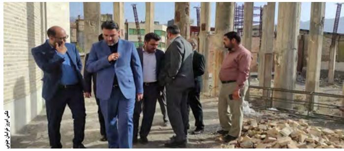
امروز خراسان جنوبی - گروه خبر ۵۵۰ پروژه فرهنگی ناتمام تا پایان دولت سیزدهم تکمیل می‌شود. معاون توسعه مدیریت و منابع وزیر فرهنگ و ارشاد اسلامی گفت: ۵۵۰ پروژه ناتمام این وزارتخانه در کشور که بیشتر آنها بیش از ۵۰ درصد پیشرفت فیزیکی دارند تا پایان دولت سیزدهم تکمیل و افتتاح می‌شود. سید محمود اسلامی در حاشیه بازدید از پروژه‌های ناتمام اداره کل فرهنگ و ارشاد اسلامی خراسان جنوبی در بیرجند در جمع خبرنگاران افزود: تمام ۵۵۰ پروژه ناتمام با لحاظ پنج هزار میلیارد تومان اعتبار در مصوبات سفر رئیس جمهور دیده شده است و به تدریج تا پایان دولت سیزدهم به بهره‌برداری می‌رسند. به گفته وی در حال حاضر ۱۵ پروژه ملی ناتمام مجتمع فرهنگی هنری داریم که از این تعداد تاکنون چهار پروژه افتتاح شده و مابقی در حال انجام و برخی آماده بهره‌برداری است. وی ادامه داد: از این تعداد پروژه‌های فرهنگی از جمله مجتمع فرهنگی هنری و تالار مرکزی شهرهای کرمان، ارومیه و ساری به بهره‌برداری رسیده و پروژه‌های اراک، خوزستان و یزد در آستانه افتتاح است.

فرهنگ هم تا هفته دولت یا پاییز امسال افتتاح خواهد شد. معاون توسعه مدیریت و منابع وزیر فرهنگ و ارشاد اسلامی افزود: تالار مرکزی شهر بیرجند نیز با توجه به اینکه پیشرفت ۱۰ تا ۱۲ درصدی از سال ۹۰ تاکنون داشته است پیگیری می‌شود تا وضعیت آن به سرانجام برسد. وی بیان کرد: ۲ پروژه عمرانی فرهنگی بیرجند تا پایان امسال افتتاح می‌شوند که نقش مؤثری در افزایش فضای فرهنگی استان دارد. معاون توسعه مدیریت و منابع وزیر فرهنگ و ارشاد اسلامی در آغاز سفر دو روزه (دیروز) از طریق فرودگاه طبرس وارد خراسان جنوبی شد. وی با پیگیری استاندار و وزارت فرهنگ و ارشاد اسلامی محقق می‌شود. وی با اشاره به بازدید از پروژه خانه فرهنگ و سالن علامه فرزاد در بیرجند گفت: برای تکمیل این ۲ پروژه ۷۰ میلیارد تومان اعتبار نیاز است و تجهیزات سالن علامه فرزاد از منابع داخلی وزارتخانه تأمین می‌شود و تا دهه فجر امسال نیز به بهره‌برداری می‌رسد، خانه