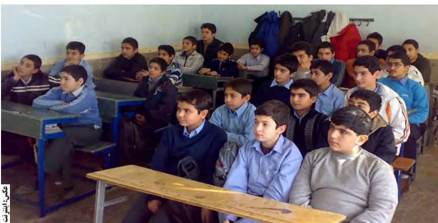
بچه ها در کلاس

امروز خراسان جنوبی- رجب زاده ۴ شهریور پارسال بود که شورای آموزش و پرورش استان با حضور شخص وزیر برگزار شد. حاضران در این شورا ، شاهد شبکه مسائلی که استاندار از وضعیت نیاز استان به فضای آموزشی برای وزیر ترسیم کرد هستند. اینکه «با توجه به خشکسالی های مکرر و مهاجرت بی رویه روستائیان به حواشی شهرها این استان نیازمندی ویژه است» ۲۰۰ کلاس درس برای ساماندهی دانش آموزان دارد. «هر چند در دولت تاکید شده اعتباری برای احداث بنای جدید به استان ها نمی دهد ولی این تصمیم برای استان های تازه تأسیس موضوعیت ندارد و فضای آموزشی این استان نیازمندی ویژه است» اینکه اگر نشود و دولت اعتبار نهد مدیریت وضعیت دشوار می شود. او همچنین به وزیر گفت: مدارس در مناطق روستایی و عشایری استان از کمبود امکانات آموزشی رنج می برند. کمک هزینه های آموزشی برای خانواده های محروم نیاز مبرم در این استان است که اگر محقق نشود امکان اینکه بعضا شاهد ترک تحصیل برخی دانش آموزان باشیم، وجود دارد. از این نیاز روی موافقت نامه ای برنامه ریزی کرده که پارسال در بیست و چهارمین جشنواره خیرین مدرسه ساز منعقد شد: موافقت نامه اجرای ۴۴ پروژه آموزشی در قالب ۱۷۱ کلاس درس با ۳۷ نیکوکار. به گفته وی سال تحصیلی گذشته جمعیت دانش آموزی استان نسبت به سال ماقبل آن ۰/۷ درصد افزایش داشت لذا مدرسه سازی با توجه به رشد جمعیت دانش آموزی، مهاجرتی بودن استان همچنین فرسودگی ساختمان برخی از مدارس پایان نیافتنی است. این شرایط برای امروز طوری است که ۴۵ باب مدرسه با بیش از ۴۵۵ کلاس درس در استان به صورت دو نوبت اداره می شود که اغلب آنها در مرکز استان است. همچنین بیش از ۶۷ هزار و ۶۰۰ دانش آموز خراسان جنوبی در قالب ۲ هزار و ۳۹۰ کلاس درس بیش از تراکم