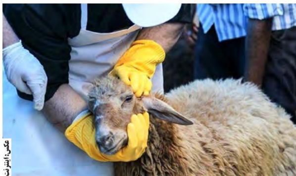
دامپزشکی ذبح شد. گذشته سه هزار و ۸۵۴ رأس دام سبک و سنگین در چرخه نظارتی بهداشتی و دامپزشکی ذبح شد. گذشته سه هزار و ۸۵۴ رأس دام سبک و سنگین در چرخه نظارتی بهداشتی و دامپزشکی ذبح شد.

شرعی دامپزشکی بازرسی شدند. ملکی گفت: با توجه به اینکه در گرمترین فصل سال، فعالیت کنه ها و خطر انتقال بیماری های خاص مانند تب خونریزی دهنده کریمه کنگو افزایش پیدا می کند نقش کشتارگاه و نظارت های بهداشتی دامپزشکی بیش از پیش نمایان می شود. به گفته وی با هماهنگی های انجام شده با هیات های مذهبی و مسئولان اجرایی استان، امسال استقبال هیات های مذهبی و شهروندان از ذبح دام در کشتارگاه های دام استان مطلوب بوده است.