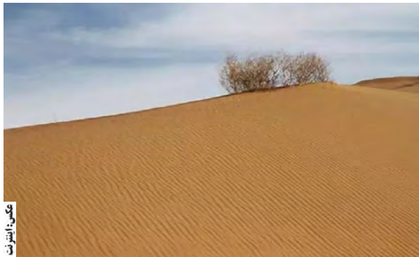
نمایشگاهی از این جاذبه ارزشمند در نگارخانه سرو باغ اکبریته برگزار کردیم.

مدیر پایگاه میراث جهانی بیابان لوت یادآور شد: البته دغدغه هایی برای حراست از بیابان لوت وجود دارد و آن برخی از تخریب ها به