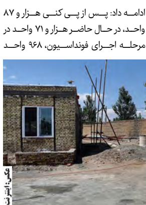
هزار و ۸۷ واحد مسکن روستایی خراسان جنوبی

بنیاد مسکن انقلاب اسلامی در روستای مزی نوغاب شهرستان درمیان آغاز شد و سهمیه استان از محل این تفاهنامه ۸۷ واحد مسکن روستایی است.