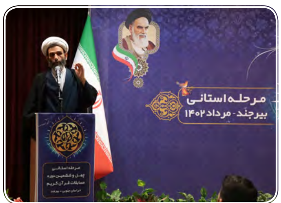
مرحله استانی بیرجند - مرداد ۱۴۰۲