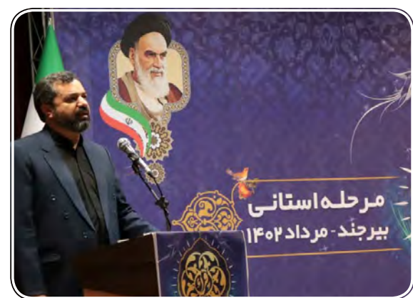
مرحله استانی بیرجند - مرداد ۱۴۰۲