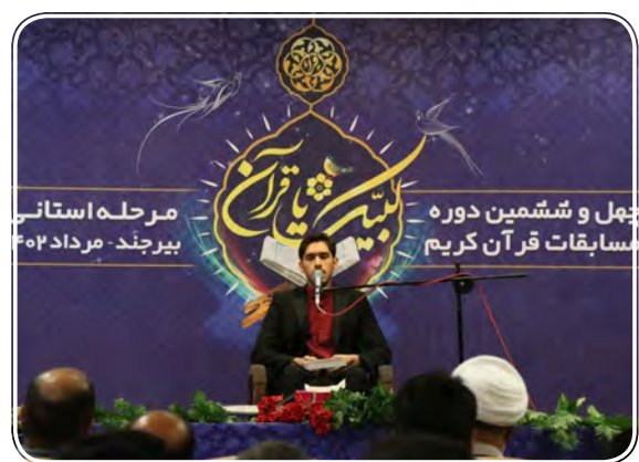
چهل و ششمین دوره مسابقات قرآن کریم بیرجند - مرداد ۱۴۰۲