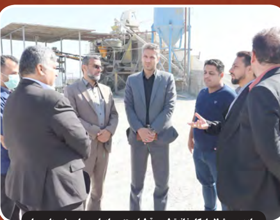
بازدید مسئولان از کارخانه تولیدی قطعات بتنی سازمان همیاری شهرداری ها