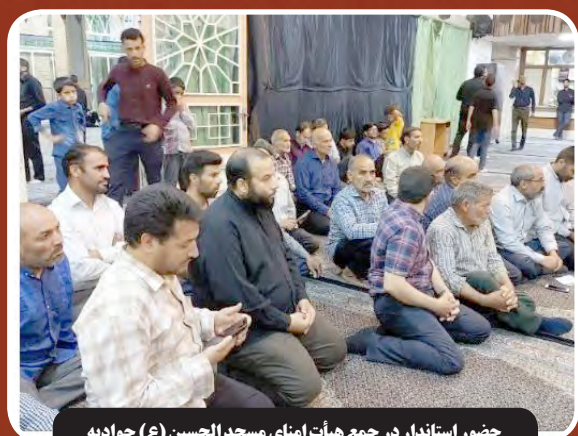
حضور استاندار در جمع هیأت امنای مسجد الحسنین (ع) جوادی