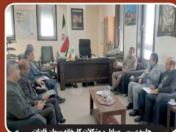
جلسه بررسی مسائل و مشکلات کارخانه سیمان قاینات