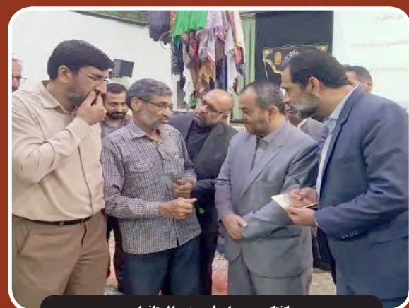
گفتگوی بی واسطه مردم با استاندار