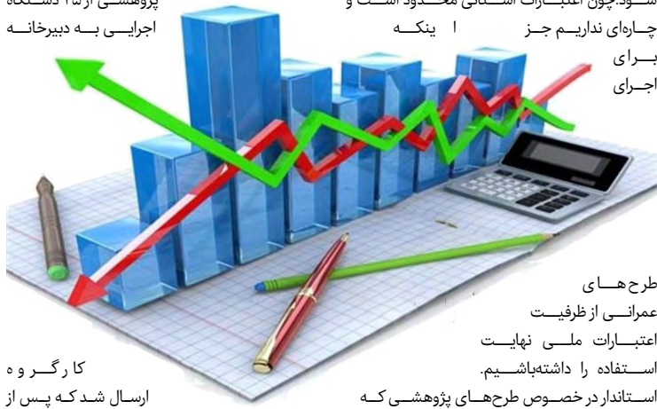
کارگر و ه

ارسال شد که پس از بررسی طرحها در جلسات گروههای کاری پژوهشی و نیز طرح موضوع در کارگروه آموزش و پژوهش استان در نهایت تعداد پنج عنوان طرح پس از تأیید اعضای شورای برنامه ریزی و توسعه، مصوب شد. در