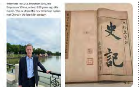
11:57 · 21 Aug 23