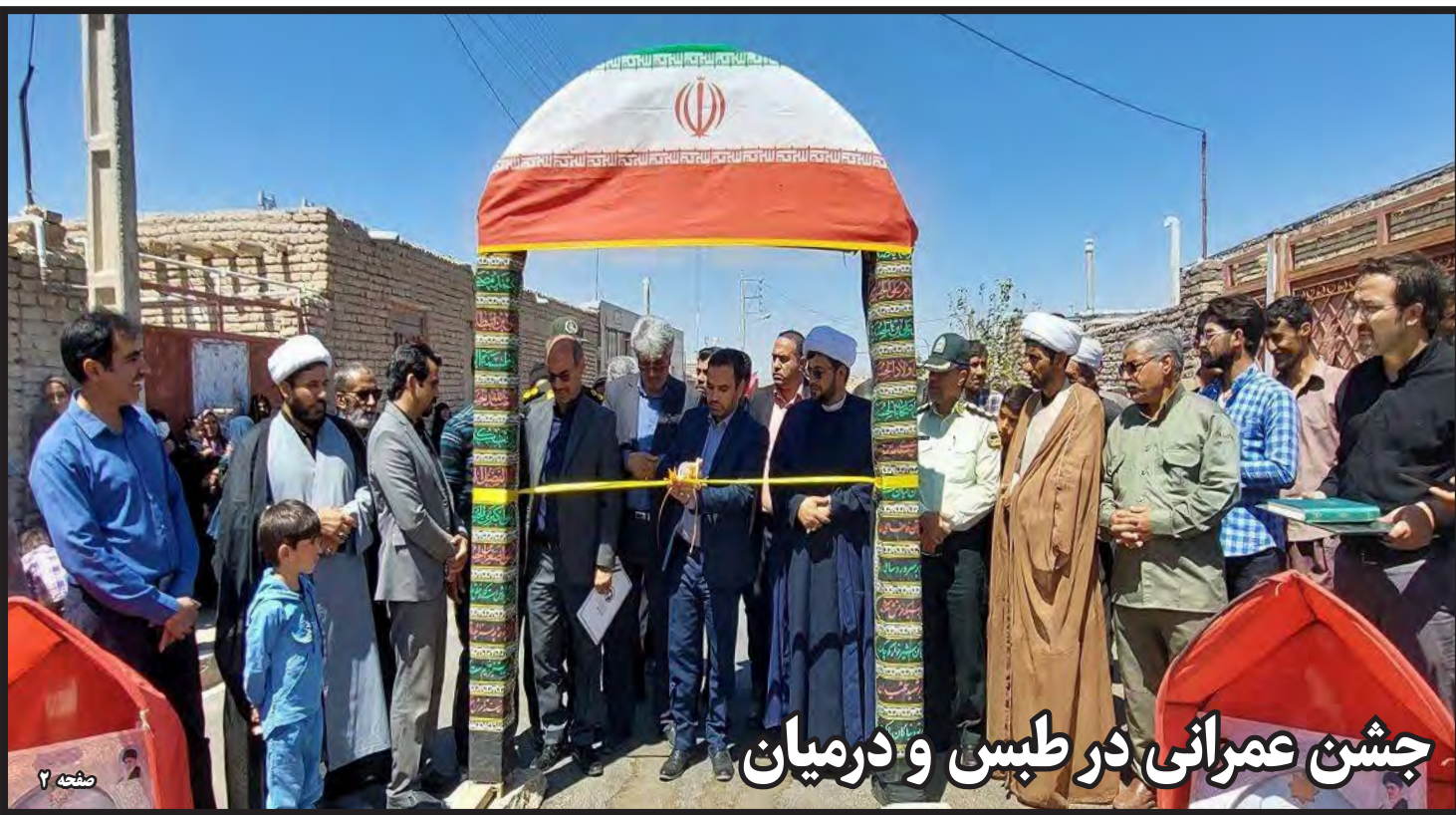
جشن عمرانی در طبس و درمیان