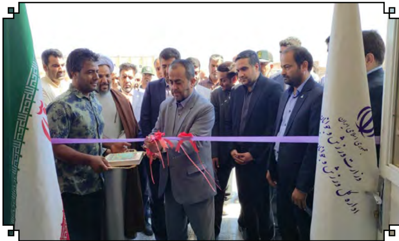
مناطق رقم خواهد خورد.