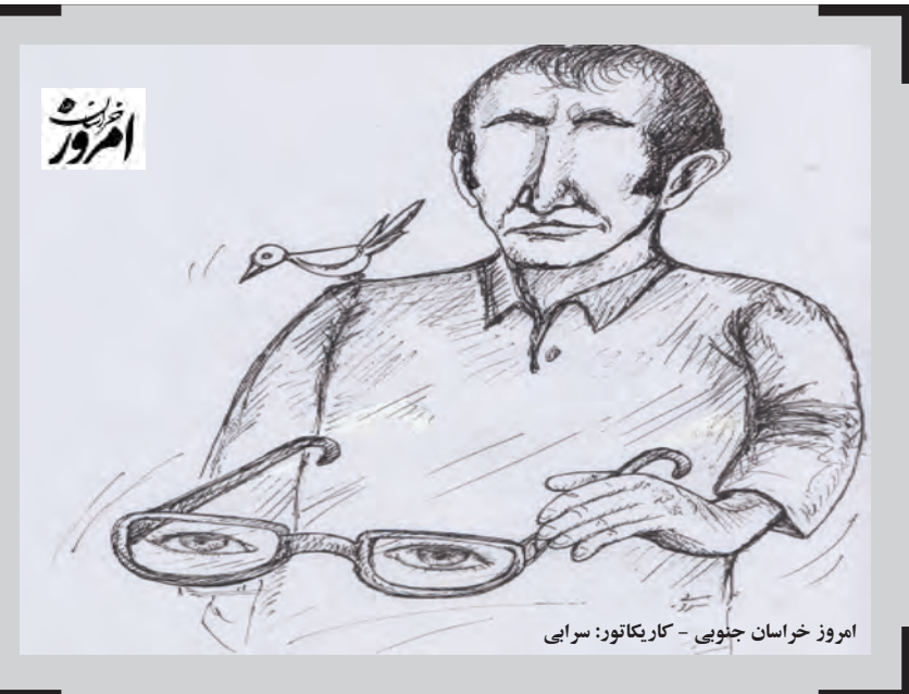
امروز خراسان جنوبی - کاریکاتور: سرایی