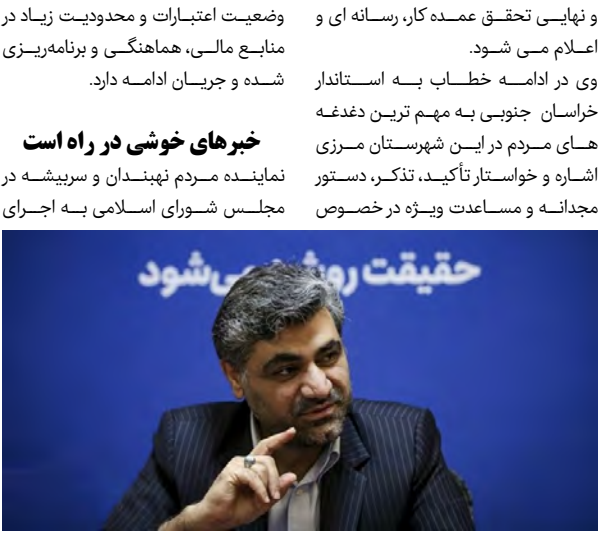
پیگیری آنها شد.