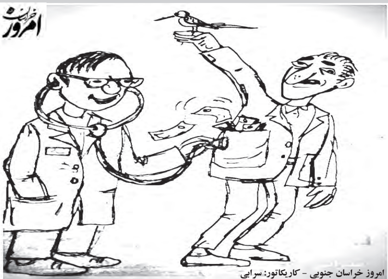
امروز خراسان جنوبي - كاريكاتور: سرايي

در اين ويژه برنامه كه در آستانه ۹ شهریور ماه روز ملي يوزپلنگ ايراني برگزار شد کارشناسان اداره حفاظت از محيط زيست اين شهرستان با حضور در جمع اعضاي اين مركز به معرفي يوزپلنگ آسيابي و ويژگي‌هاي آن و همنين خطر در انقراض بودن اين حيوان نادر پرداختند.