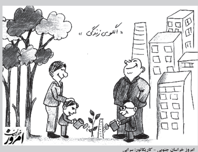
امروز خراسان جنوبی - کاریکاتور: سرایی

امروز خراسان جنوبی - رجب زاده گاه در میان هیاهو و غوغای بی پایان لحظاتی از آنچه عمر می‌نامیم، آنچه نامش را زندگی گذاشته ایم، لایه لای دست و پا زن ها و بالا و پایین شدن ها برای به دست آوردن ها، صدایی، نجوایی لطیف، شاید هم صدا نیست، چیزی از درون، همه چیز را نگه می‌دارد، معلق می‌شوی، ثانیه ای لذت در سکون، تو را به خود جلب می‌کند، چشم هایت را به خود می‌کشد و می‌پرسد؟ که هستی؟ تو که هستی؟ اینجا چه می‌کنی، در جستجوی کدامین خواهش در زمان غوطه وری؟ هر بار که او می‌پرسد و تو می‌شنوی، گویی با پیچیده ترین سؤالی که پرسیده شده مواجهی! سؤالی که هر کس با توجه به شناخت خود و یافته‌ها یا حتی آموزه های طوطی وار، پاسخی به آن بدهد اما پراستی دقیق است؟ گویی همه موجودیت ما هموست، او که از درون ندایی بر می‌آورد و هرگاه می‌شنویم، تکلمان می‌دهد تا پرسد: آهای تو کیستی؟ او می‌داند که ما می‌دانیم که هستیم اما از یاد برده‌ایم، او این سؤال را تکرار می‌کند تا از چرخه فراموشی راهی برای رهایی بیابیم و بیشتر و بیشتر عمیق شویم، می‌پرسد تا همه لایه‌هایی که بر آن هویت حقیقی کشیده ایم را یکی پس از دیگری پس بزنیم و رقص او را به نظاره بنشینیم؛ چرخش بی نقص و روحبخشش برای بودن برای درک این سؤال که چه کسی هستیم؟