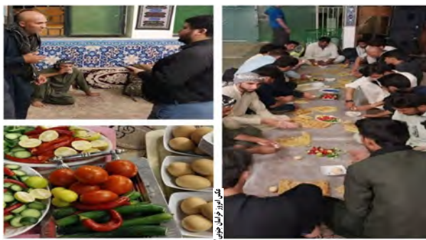
پیاده اربعین حسینی در موكب امامزاده زید بن محمد قاین اسكان و پذیرایی شدند.

پور با توجه به اینکه خراسان جنوبی معیری برای زائران اربعین به ویژه زائران پاکستانی، هندی و افغانستانی بوده، مکان هایی برای پذیرایی و اسكان زائران در محل بقاع متبرکه استان پیش بینی شده است. مدیرکل اوقاف و امور خیریه خراسان جنوبی تصریح کرد: امسال ۵ موكب در بقاع متبرکه ای که در مسیر زائران در استان قرار دارد برای پذیرایی از زائران اربعین پیش بینی شده است.